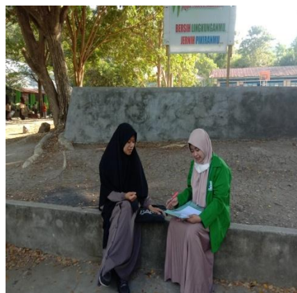
Gambar 3. Wawancara dengan Guru BK