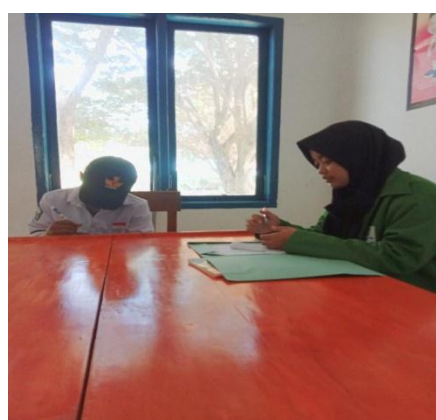
Gambar 5. Wawancara dengan peserta didik