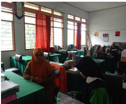
Gambar 1. wawancara dengan Guru PAI