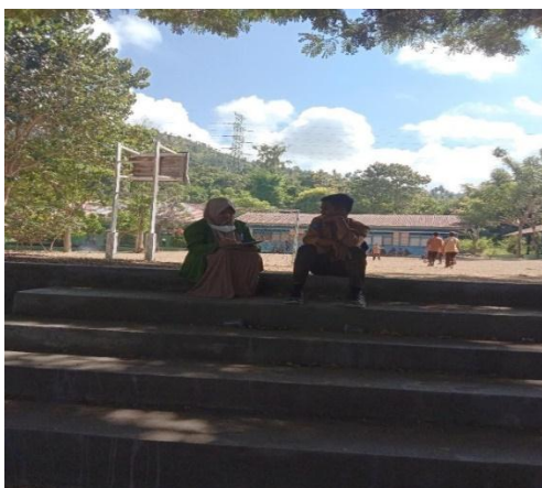
Gambar 6. Wawancara dengan peserta didik