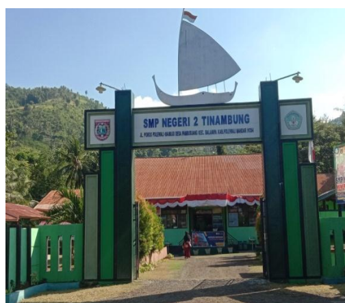
Gambar 7. Gerbang sekolah