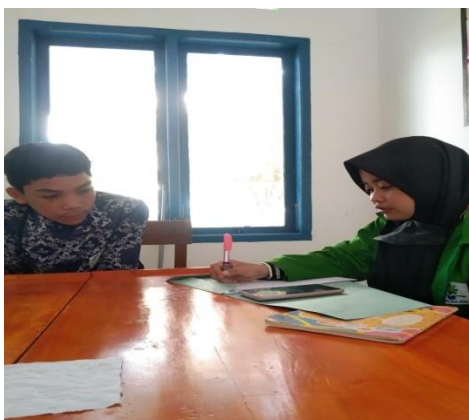
Gambar 4. Wawancara dengan peserta didik