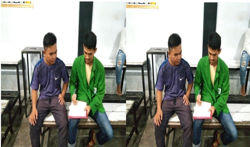
Masdik (Konsumen) Wawancara Tanggal 11 Desember 2023