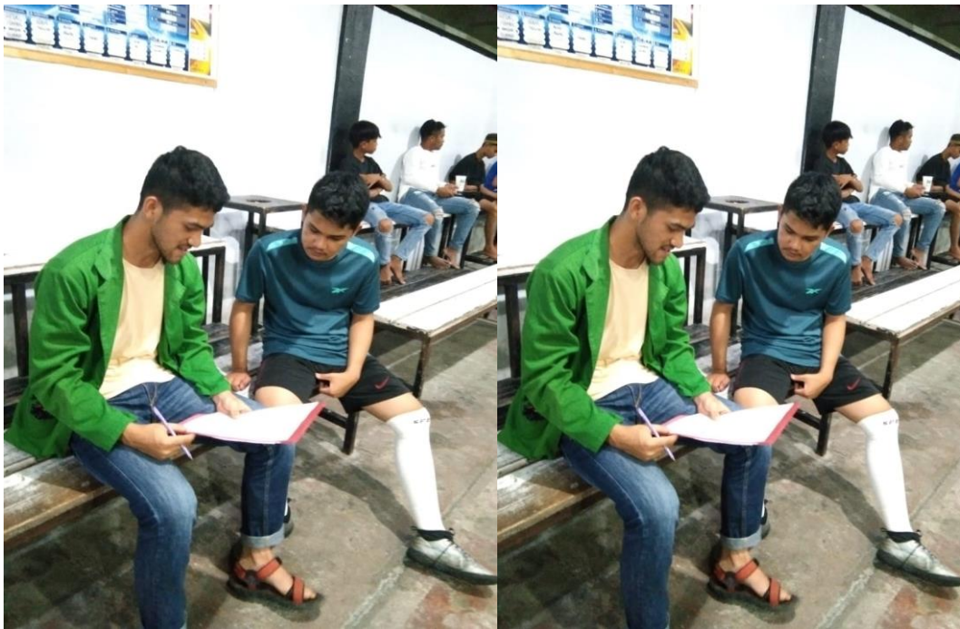
Munding (Konsumen) Wawancara Tanggal 11 Desember 2023.