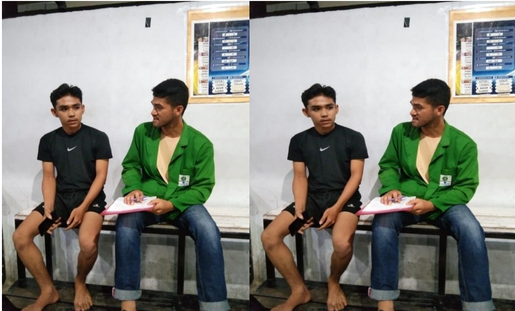
Alamsya (Konsumen) Wawancara Tanggal 11 Desember 2023.