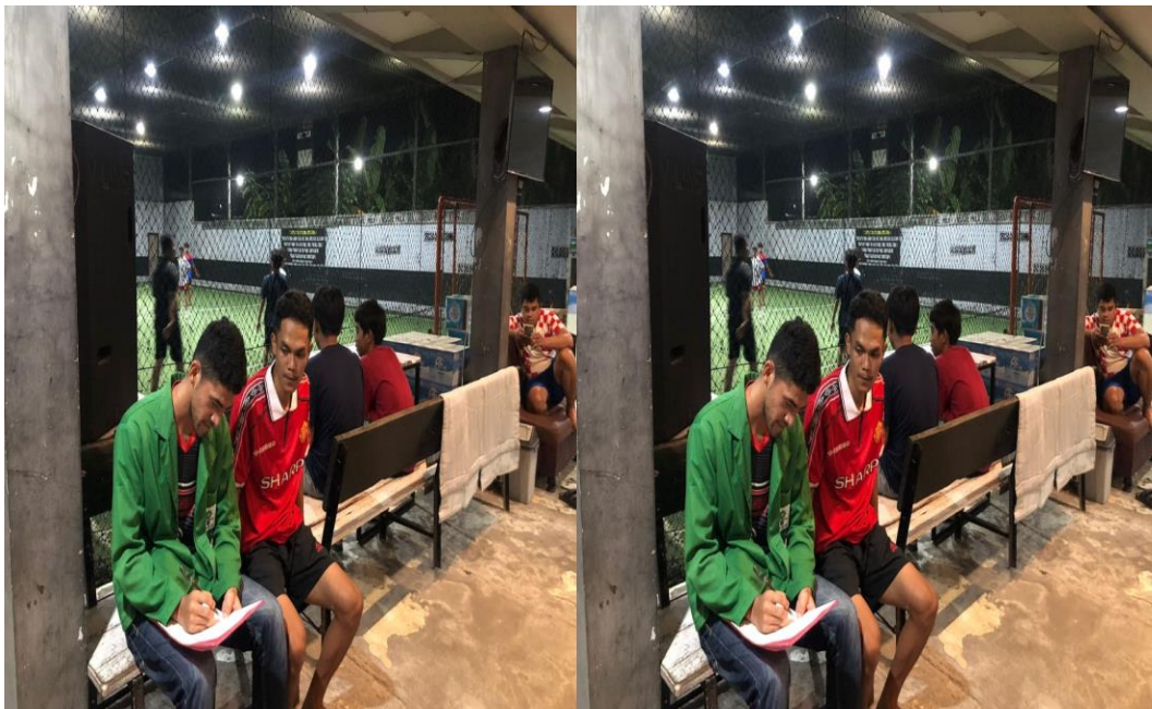
Prawansa (Konsumen) Wawancara Tanggal 11 Desember 2023.