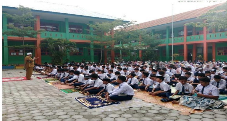
Gambar 2. ( Pelaksanaan Kegiatan Ibadah Sholat Dhuha )