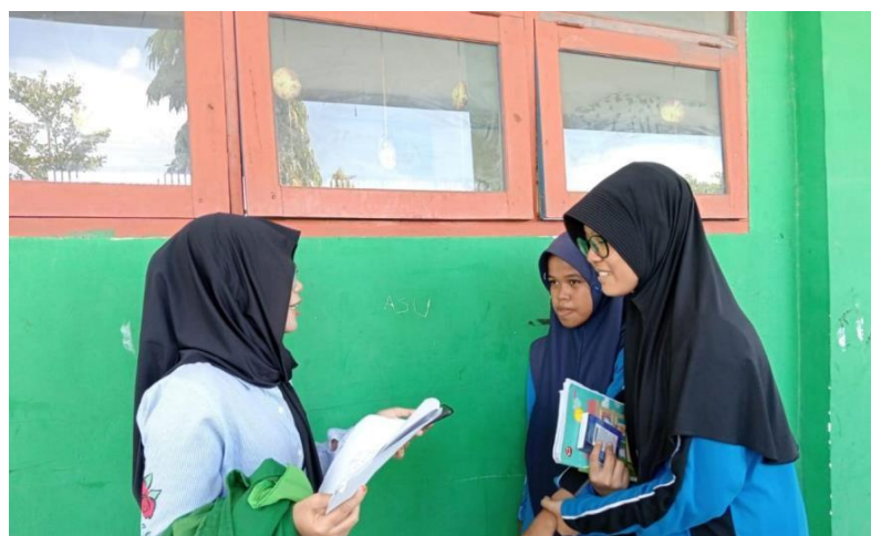
Gambar 2. (wawancara Peserta didik kelas VIII)