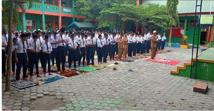
Gambar 1. ( Pelaksanaan Kegiatan Ibadah Sholat Dhuha )