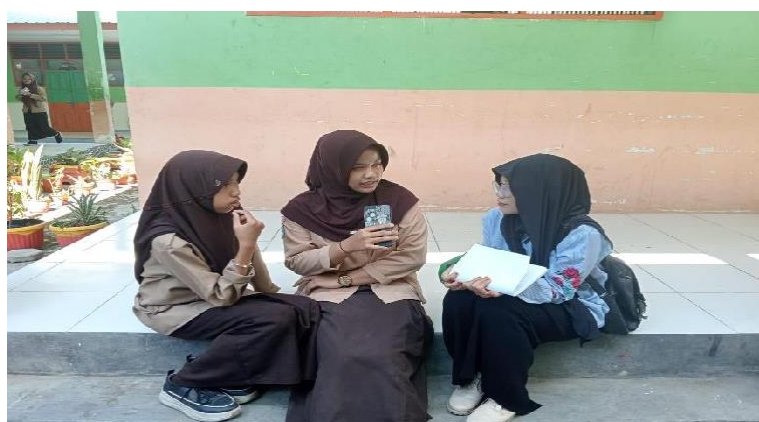
Gambar 3. (wawancara Peserta didik kelas VIII)