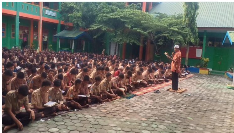
Gambar 3. ( Pelaksanaan Kegiatan Ibadah Sholat Dhuha )