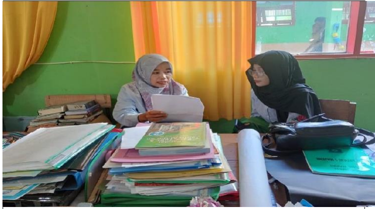
Gambar 1. (wawancara Guru Mapel Guru PAI)