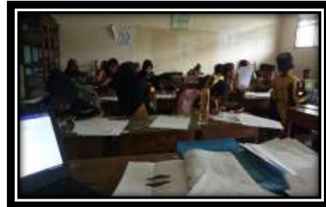
Foto bersama peserta didik kelas IV