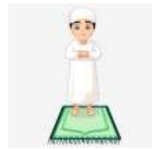
MEMBACA DO'A IFTITAH