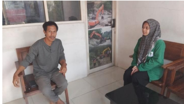
Wawancara bersama pemilik SPBU