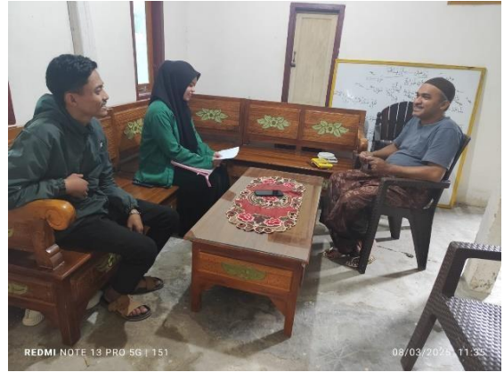
Wawancara bersama Tokoh Agama di Tinambung