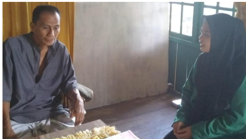
Wawancara bersama masyarakat