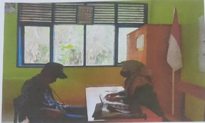
Suasana Pembelajaran Berlangsung