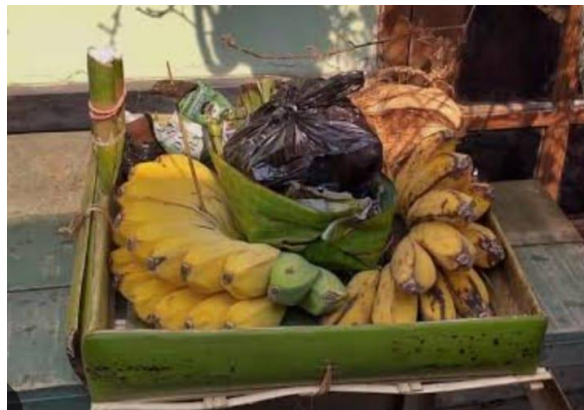
Gambar 3. Perlengkapan Ziarah

Pernyataan tersebut menunjukkan bahwa dalam praktik tradisi ziarah makam wali di masyarakat Desa Bonde keberadaan pisang bukan sekadar pelengkap melainkan bagian penting yang memiliki makna tersendiri. Pisang digunakan sebagai salah satu unsur dalam sesajen atau bawaan ziarah yang biasanya diletakkan bersama makanan tradisional lainnya seperti kue, air putih, dan bunga seperti contoh di bawah ini: