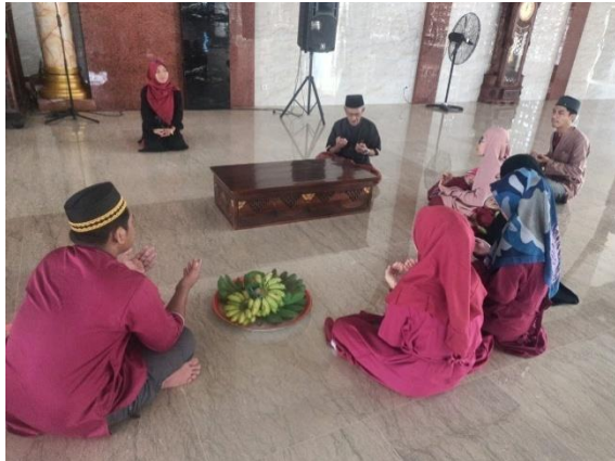
Gambar 1. Prosesi Ziarah Makam sebelum Pernikahan

Di era modern dengan kemajuan pesat dalam ilmu pengetahuan Islam dan penyebarannya yang telah menjangkau berbagai penjuru dunia, tidak dapat disangkal bahwa hal tersebut merupakan hasil dari perjuangan para ulama terdahul namun perkembangan ini juga membawa dampak terhadap pola kebiasaan umat Islam. Sejak masa Khulafaur Rasyidin hingga kini berbagai persoalan umat terus berkembang termasuk dalam hal pelaksanaan ziarah kubur. Fenomena ini masih sering dijumpai dalam lingkungan masyarakat maupun keluarga khususnya terkait waktu dan tempat pelaksanaannya yang menjadi perdebatan tersendiri misalnya waktu idul fitri, idul adha, sebelum melangsungkan pernikahan, hari jum'at dan waktu lain-lainnya. 58