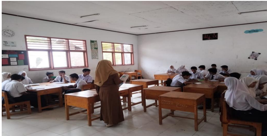
Gambar 2.2 Kegiatan Belajar Mengajar dalam kelas IX dengan Metode Listening Team di SMPN SATAP Panyampa

menyuruh setiap kelompok untuk tampil di depan kelas menyampaikan dan menjelaskan apa yang peserta didik pahami mengenai haji dan umrah.