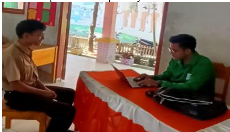
Gambar 2.3 Wawancara dengan salah satu peserta didik kelas IX di SMPN SATAP Panyampa

"Saya menyukai pembelajaran agama dalam bentuk kelompok ini karena kita bisa berdiskusi dengan teman saya untuk memahami materi pelajaran serta guru memberikan pemahaman kepada saya".