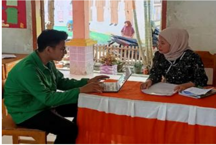
Gambar 2.1 Wawancara Dengan Guru Pendidikan Agama Islam (PAI) di SMPN SATAP Panyampa

kelompok-kelompok, setiap kelompok memiliki tugas masing-masing, kemudian saya menyajikan materi pelajaran dengan ceramah dan saya dapat meyakini peserta didik bahwa metode listening team tidak membosankan melihat atau memahami anak-anak yang betul-betul mengerti serta memberikan pemahaman dan motivasi terhadap peserta didik dan membuat peserta didik aktif dalam berdiskusi sehingga proses pembelajaran efektif".