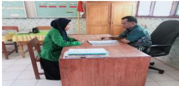
Gambar Wawancara dengan kepala sekolah