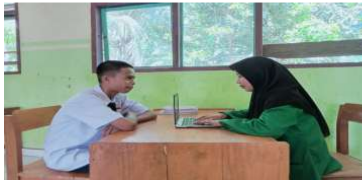
Gambar wawancara dengan peserta didik