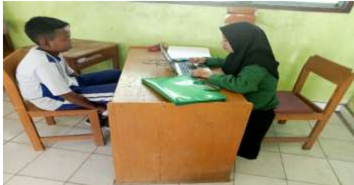
Gambar Wawancara Dengan Peserta didik