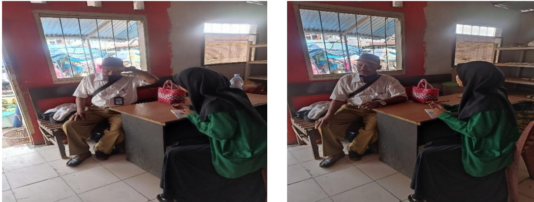
Ket. Wawancara Kepada Pengelola Pasar