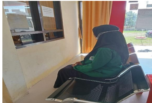
Ket. Memberikan Surat Izin Meneliti di Kantor Lurah Sidodadi