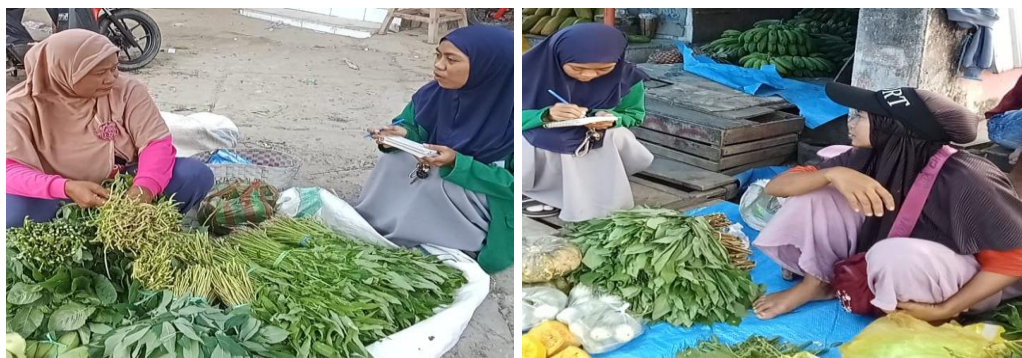
Ket. Wawancara Kepada Pedagang Sayur/Penerima Pinjaman