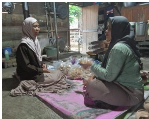
Ket. Wawancara Kepada Pihak Pemberi Pinjaman