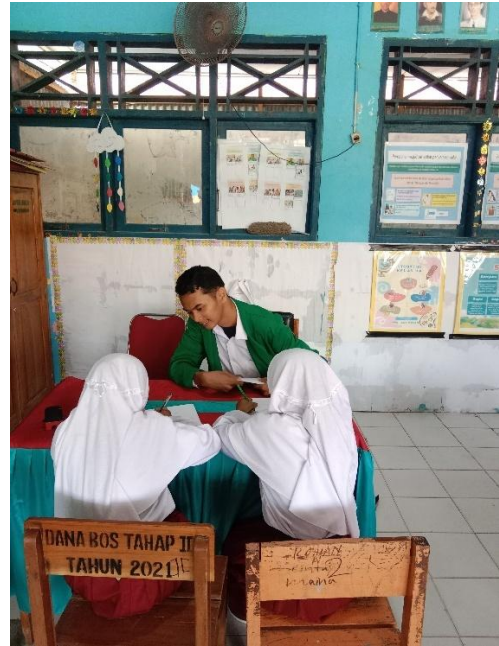
Foto Kegiatan Post-test