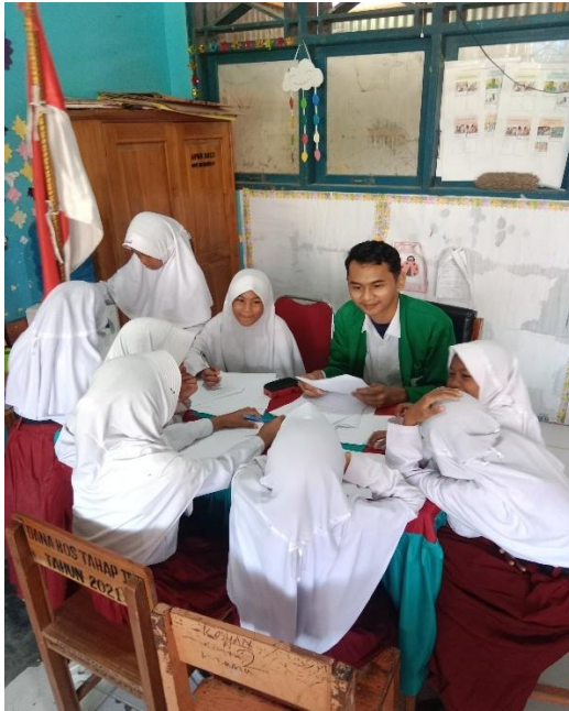
Foto Kegiatan Pre-test