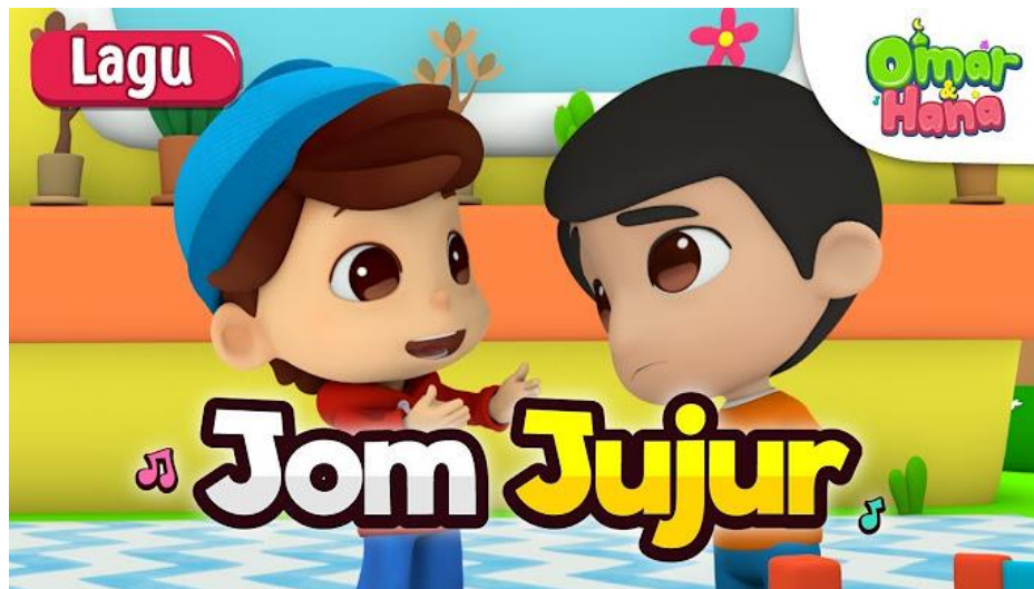
Gambar 2. 1 Episode Jom Jujur

Dalam episode "Jom Jujur", serial Omar dan Hana menggambarkan penanaman nilai kejujuran melalui interaksi antara Mama dan anak-anaknya. Cerita berpusat pada insiden di mana Hana tidak sengaja menumpahkan makanan Mama. Awalnya, Hana merasa takut untuk mengakui perbuatannya, tetapi Mama dengan bijaksana memberikan kesempatan bagi Hana untuk menjelaskan. Setelah diberi waktu untuk merenung, Hana akhirnya memberanikan diri untuk jujur. Mama menanggapi dengan positif, menjelaskan makna kejujuran melalui nyanyian dan memberikan pujian atas keberanian Hana.