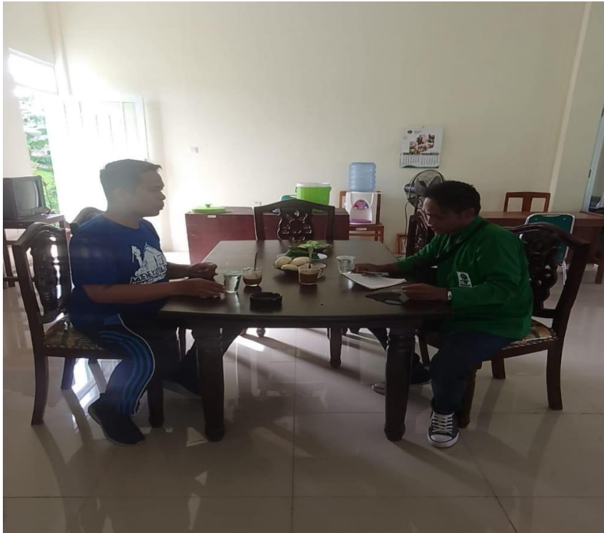
Foto wawancara bersama penyuluh KUA banggae