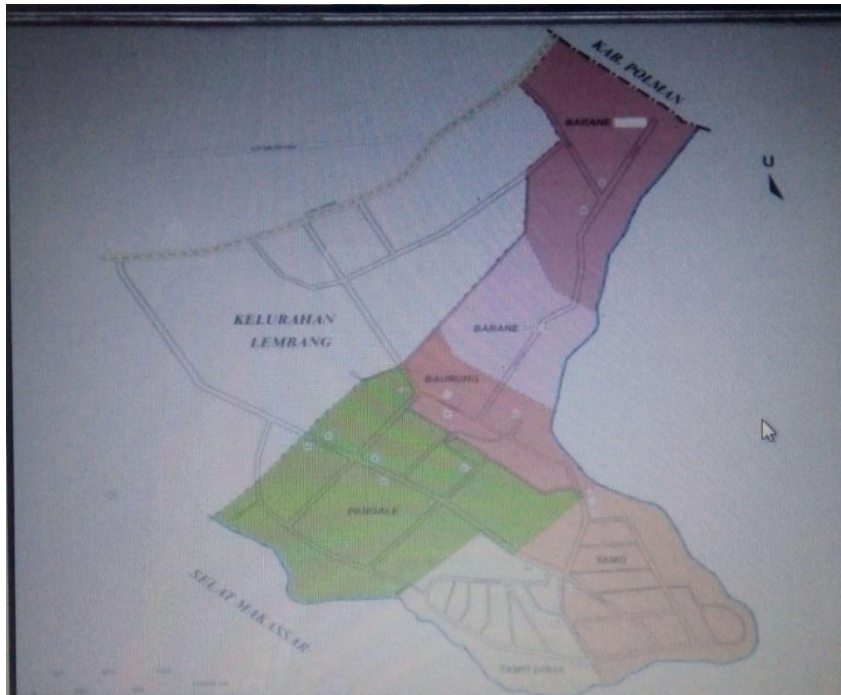
Gambar 4.1 : Gambar Peta Kelurahan Baurung

Kelurahan Baurung adalah salah satu dari 40 desa dan kelurahan yang ada di wilayah Kabupaten Majene. Kelurahan Baurung tepatnya berada dalam wilayah Kecamatan Banggae Timur Kab. Majene Provinsi Sulawesi Barat. Kelurahan Baurung terbentuk pada tahun 1995 dengan bentang wilayah kelurahan meliputi pesisir pantai, dataran rendah dan berbukit-bukit. Kelurahan ini termasuk dalam kawasan wisata dan pertambakan.