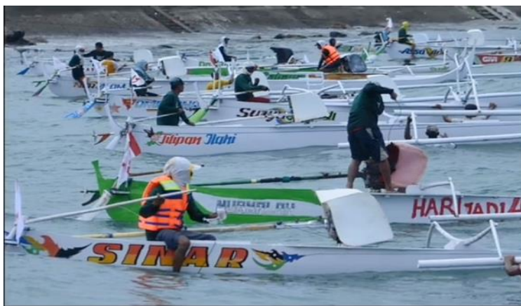
Gambar 2: Semarak pesta Nelayan