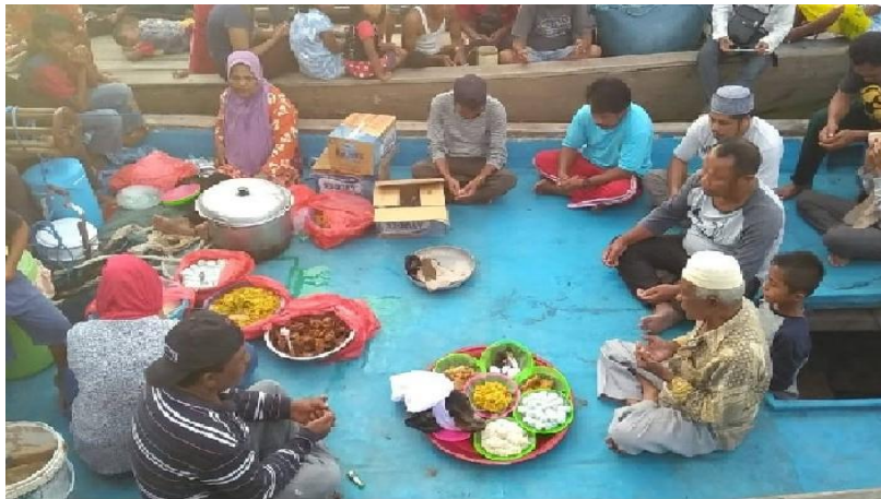
Gambar 3: Pembacaan barzanji