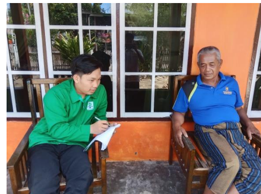
Gambar 1: Wawancara bersama para Narasumber