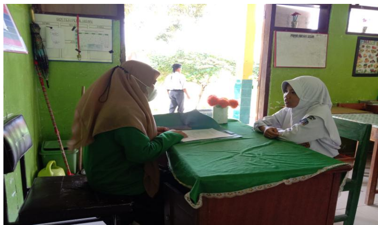
Gambar.4 Wawancara Peserta Didik