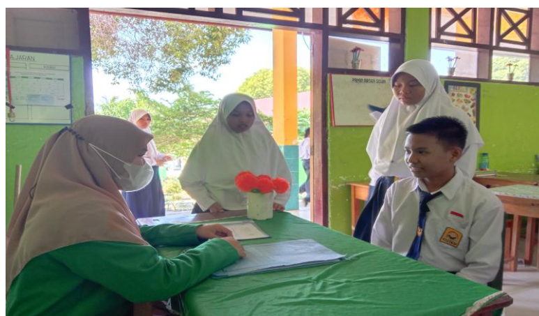
Gambar. 6 Wawancara Peserta Didik