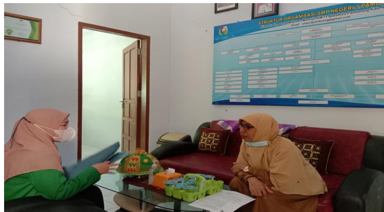
Gambar 2. Wawancara Guru Pendidikan Agama Islam