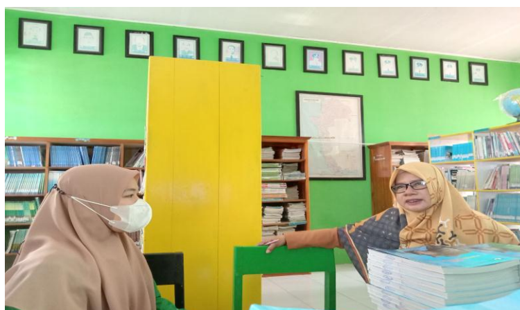
Gambar 3. Wawancara Guru Pendidikan Agama Islam