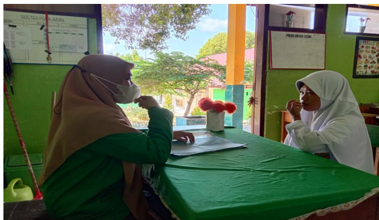
Gambar. 5 Wawancara Peserta Didik