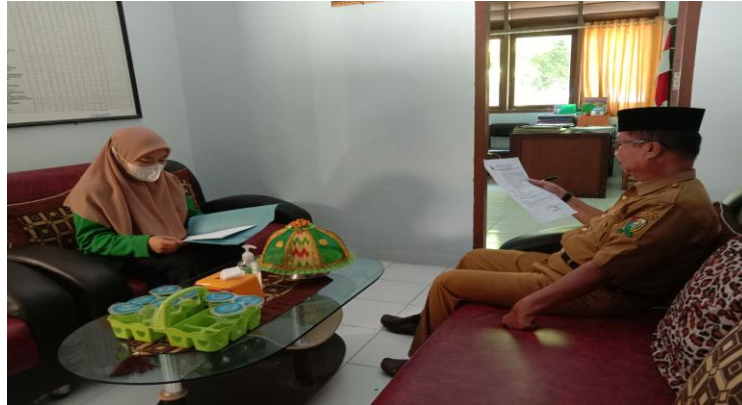
Gambar. 1 Wawancara Kepala Sekolah