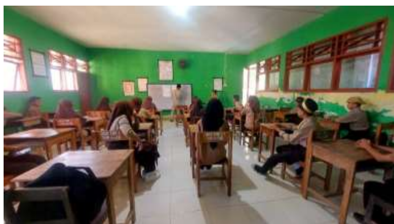
Lampiran 7. Wawancara Guru SKI