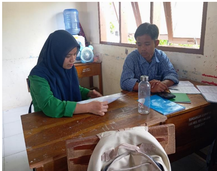
Gambar 5. Wawancara Peserta Didik