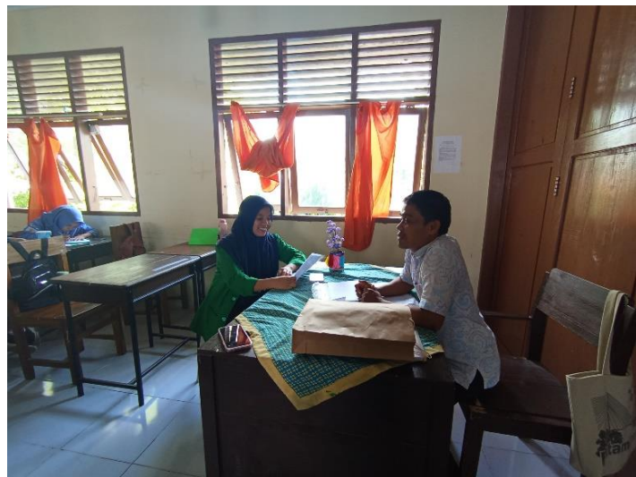
Gambar 3. Wawancara Guru PAI