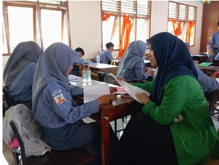
Gambar 6. Wawancara Peserta Didik