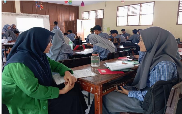
Gambar 4. Wawancara Peserta Didik