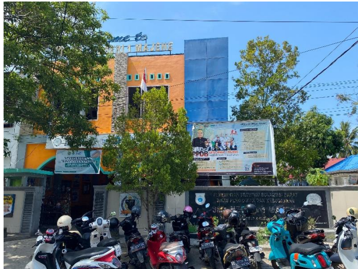
Gambar 1. UPTD SMA Negeri 1 Majene