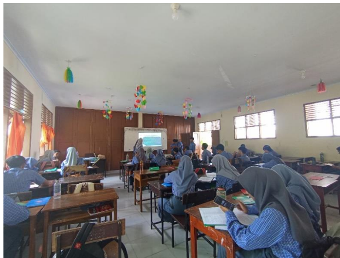
Gambar 7. Proses pembelajaran berlangsung