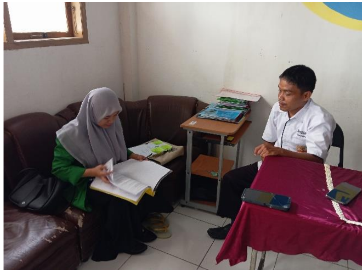
Gambar 2. Observasi