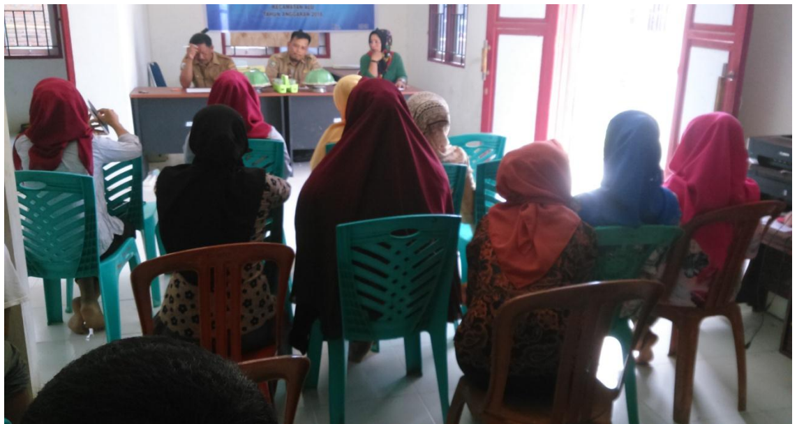
Monitoring Pendamping Program Keluarga Harapan (PKH) yang dilaksanakan setiap bulan sebelum pandemi.