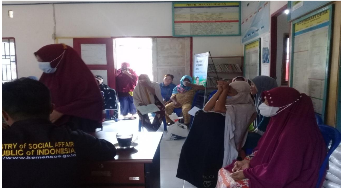
Penyaluran bantuan beras kepada seluruh peserta Program Keluarga Harapan (PKH)