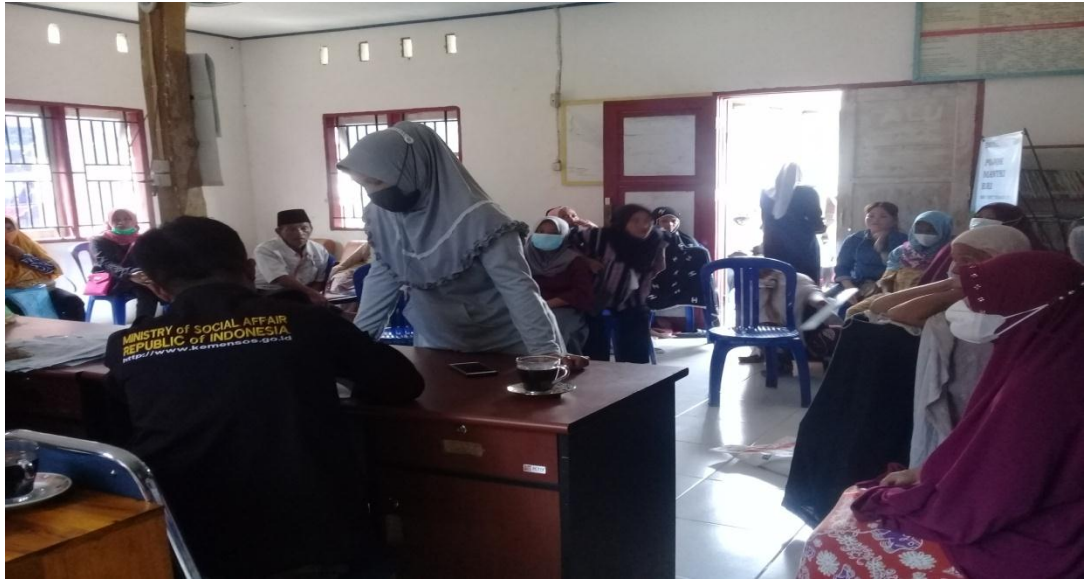
Penyaluran bantuan beras kepada seluruh peserta Program Keluarga Harapan (PKH)