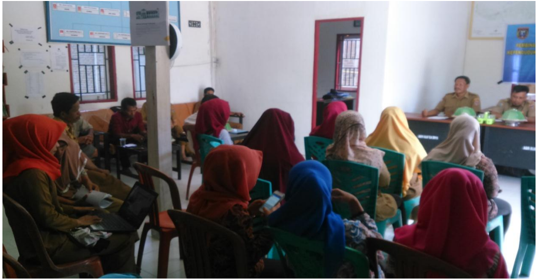
Monitoring Pendamping Program Keluarga Harapan (PKH) yang dilaksanakan setiap bulan sebelum pandemi.