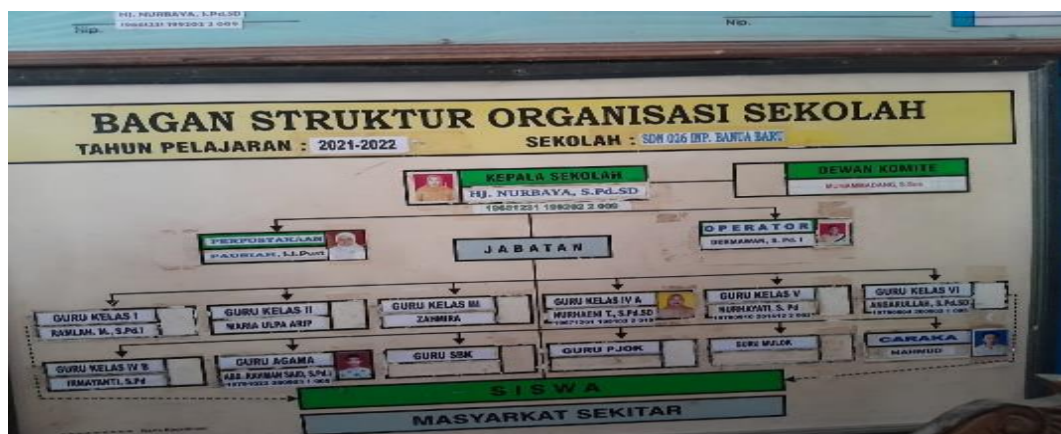
Struktur Organisasi SDN 026 Banua Baru