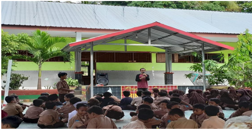
Pelaksanaan kegiatan keagamaan Jum'at Religi di SDN 026 Banua Baru