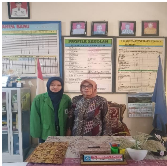
Foto bersama dengan ibu kepala sekolah SDN 026 Banua Baru