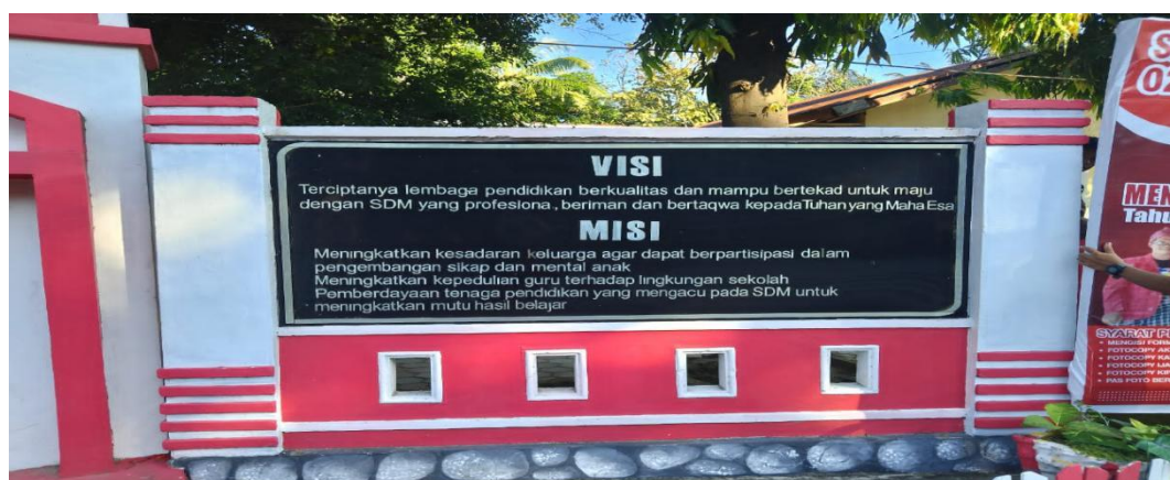
Visi Misi SDN 026 Banua Baru