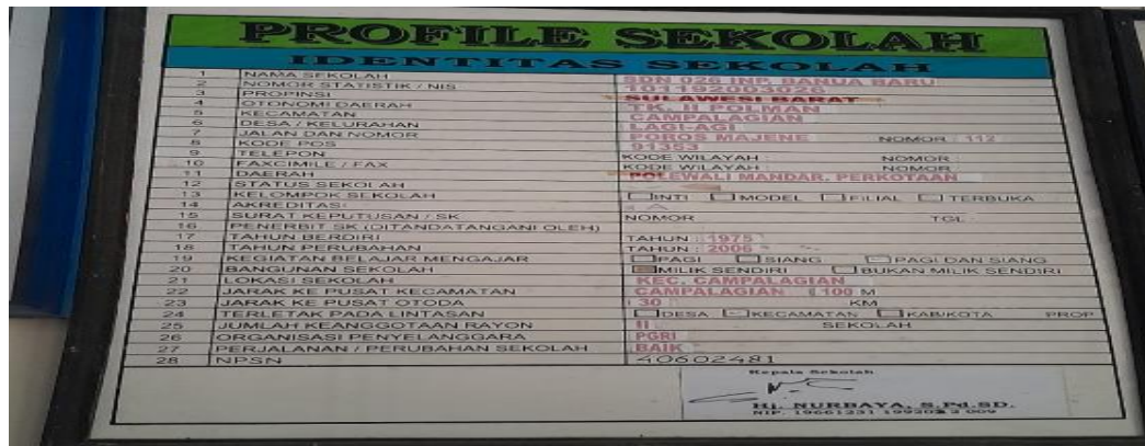
Profil sekolah SDN 026 Banua Baru