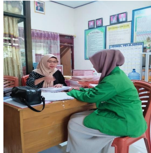
wawancara bersama guru di SDN 026 Banua Baru