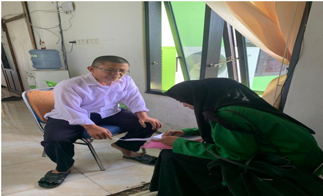
Wawancara dengan pihak Kementerian Agama Kabupaten Polewali Mandar