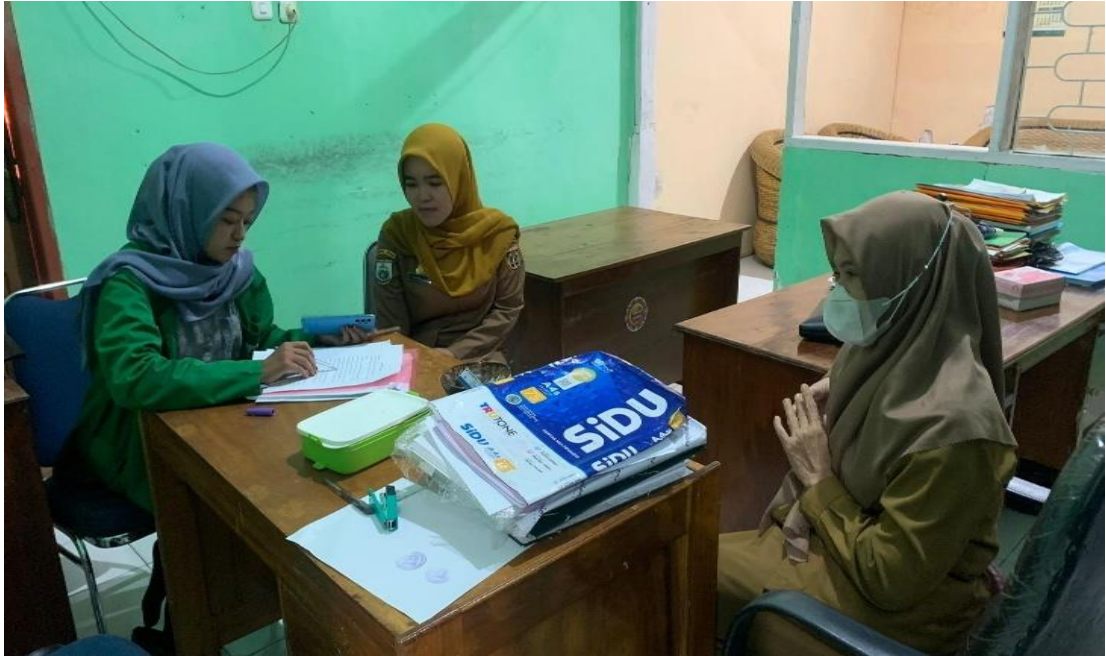
Wawancara dengan pihak Dinas Perindustrian dan Perdagangan Kabupaten Polewali Mandar