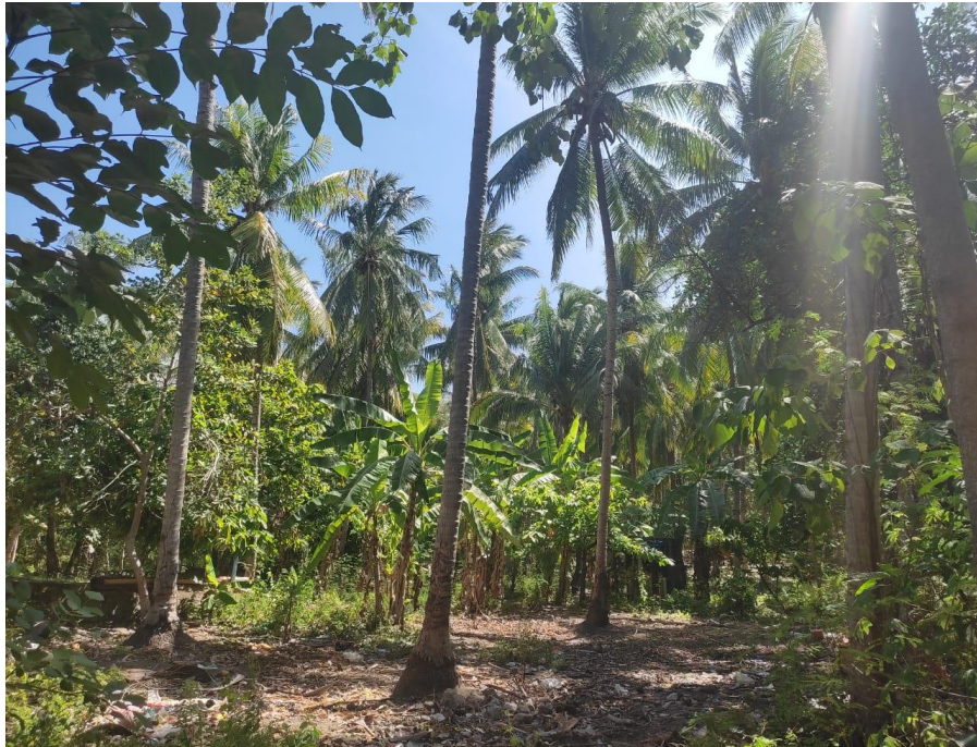
Gambar 1.5 kebun kelapa milik ibu Ramlah selaku pemberi pinjaman