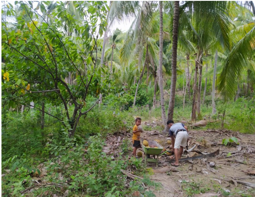
Gambar 1.6 Pak Deni Arpan saat melakukan jasa angkat kelapa