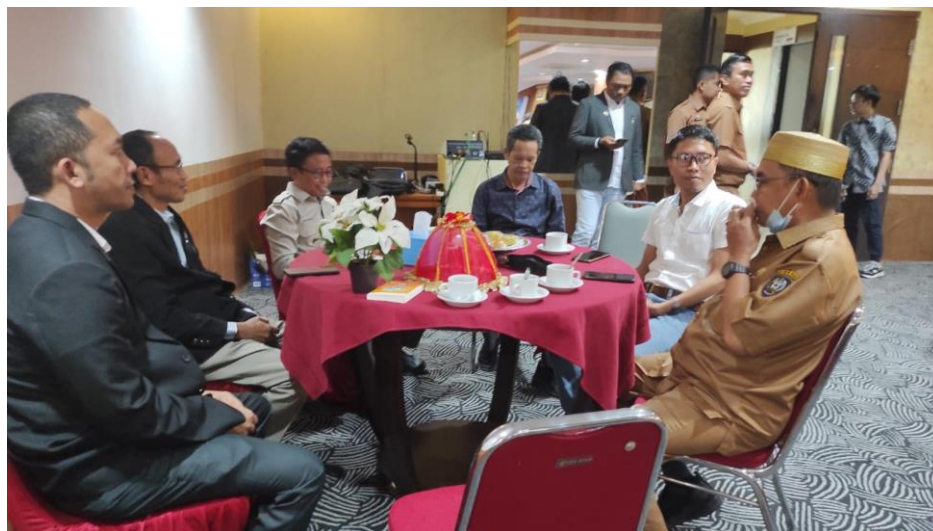
Gambar. 2. Koordinasi Terkait Jadwal, Metode, dan Muatan Materi

Metode itu disepakati oleh penulis dengan panitia karena mengingat bahwa penerapan metode tersebut dapat lebih efektif sebagaimana tujuannya yaitu agar materi yang disampaikan pada satu pertemuan tersebut dapat dikuasai oleh peserta, maka dengan begitu, proses pembelajaran yang singkat tetap bisa berjalan efektif (Rohma & Prihatini, 2022). Selain itu, dilakukan pula koordinasi dengan narasumber lainnya dari pihak Universitas Handayani Makassar, hal tersebut dimaksudkan agar muatan materi yang disampaikan oleh pemateri lainnya tidak berulang dan memastikan materinya tidak saling kontradiktif, karena bimbingan yang berkelanjutan dapat meningkatkan motivasi dan keseriusan guru dalam belajar mengembangkan diri (Sopiah, 2019). Hasil koordinasi tersebut membuat materi yang disampaikan oleh penulis dengan pemateri lainnya, tidak hanya fokus (tidak berulang), tetapi juga saling berkaitan.