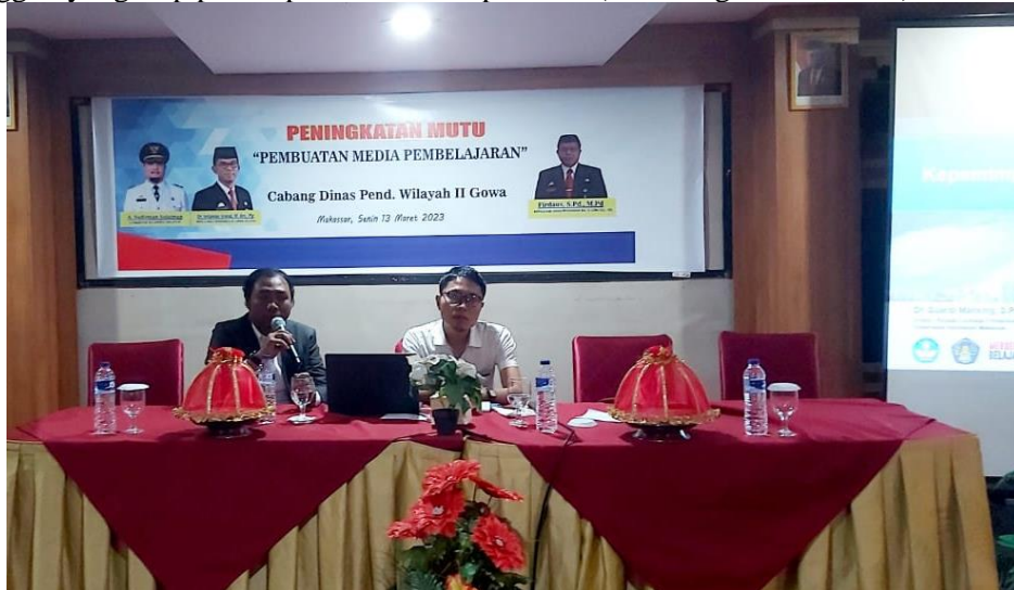
Gambar. 3. Proses Pemaparan Materi Oleh Narasumber

yang hebat. Muatan materi tersebut dipilih karena mengingat bahwa kepemimpinan bermanfaat dan berkontribusi positif dalam dinamika kerja karena membentuk pola pikir yang baik, dan karakter tangguh yang siap pemimpin melalui adaptasi era (Simorangkir dkk, 2021).