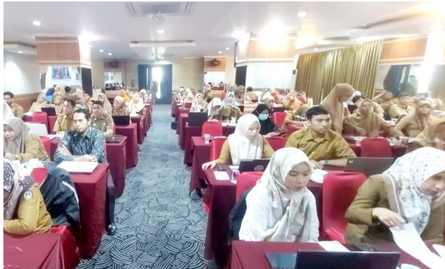
Gambar. 5. Suasana Saat Sesi Tanya-Jawab Berlangsung