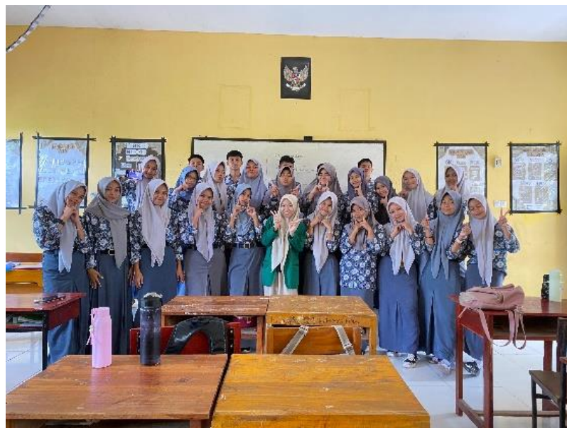
Gambar 2. Dokumentasi setelah Observasi Awal