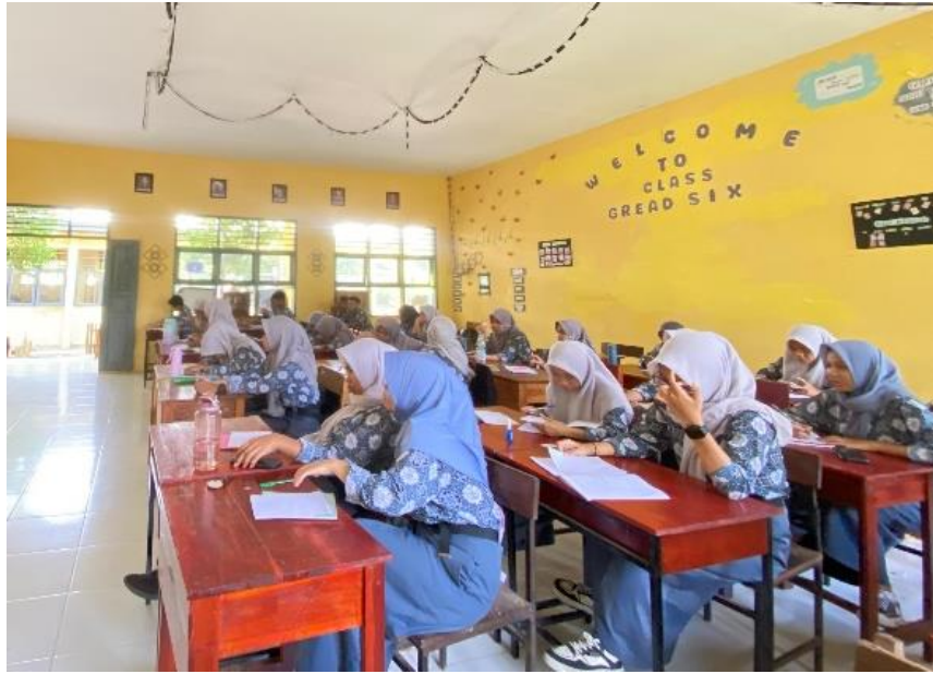
Gambar 3. Kegiatan Pretest Peserta didik