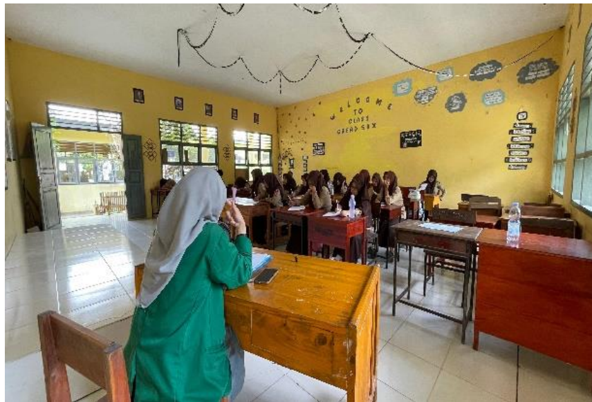
Gambar 4. Penyampaian Materi