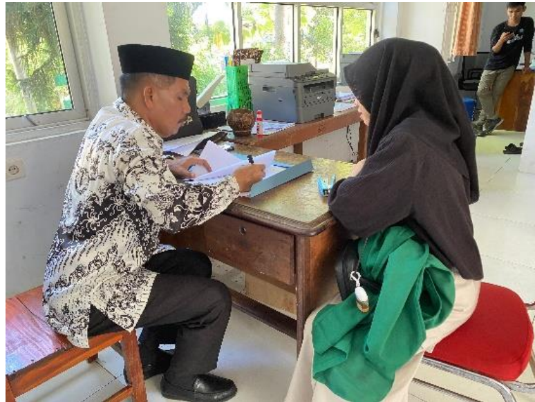
Gambar 1. Penilaian Valid Soal Essay oleh Kepala Sekolah SMAN 1 Sendana