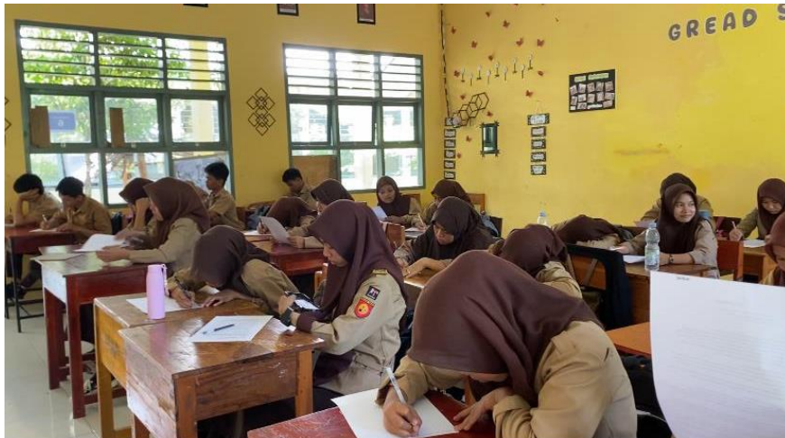
Gambar 9. Kegiatan Posttest peserta didik