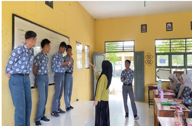
Gambar 5. Penerapan Strategi Inkuiri melalui metode Snowball Throwing