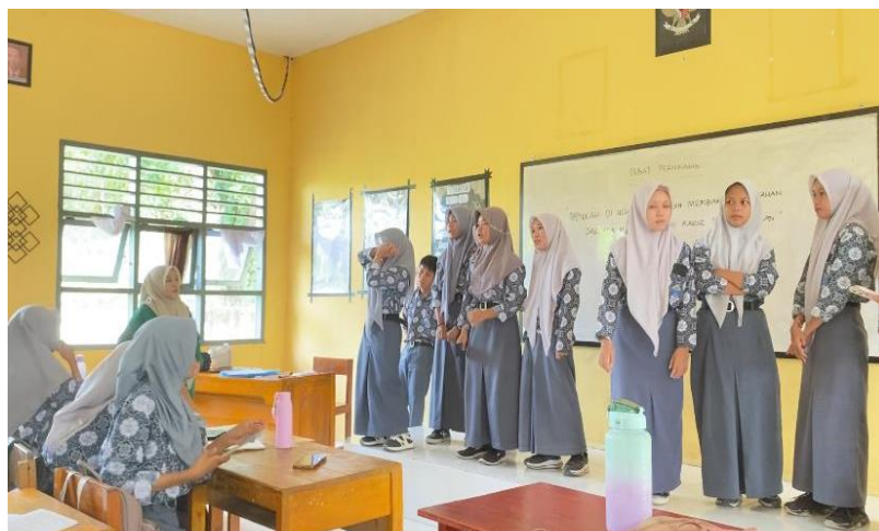
Gambar 7. Penerapan Strategi Inkuiri melalui metode diskusi kelompok