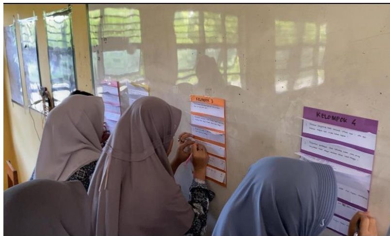
Gambar 6. Penerapan Strategi Inkuiri melalui metode TGT