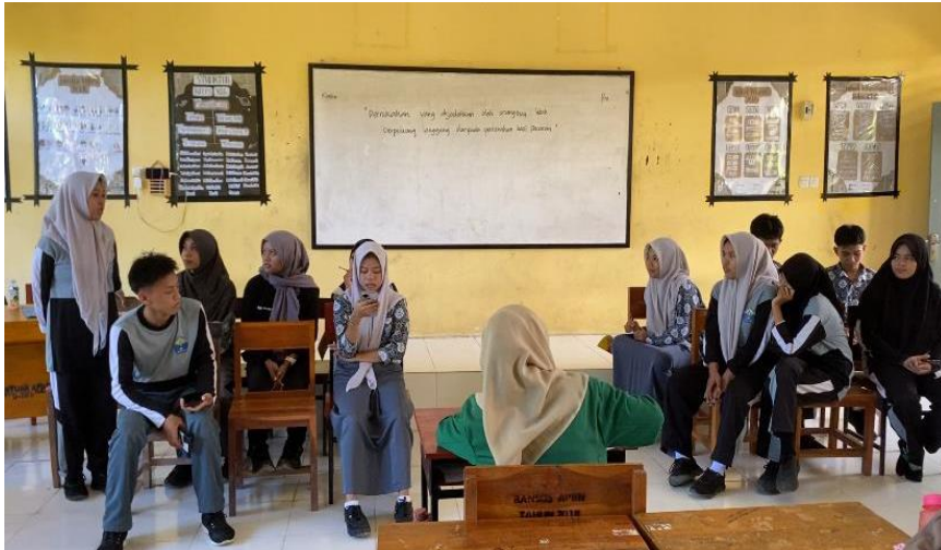
Gambar 8. Penerapan Strategi Inkuiri melalui debat