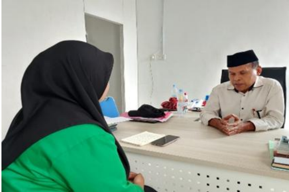
Gambar 1. 1 Ahli Hukum Ekonomi Syariah