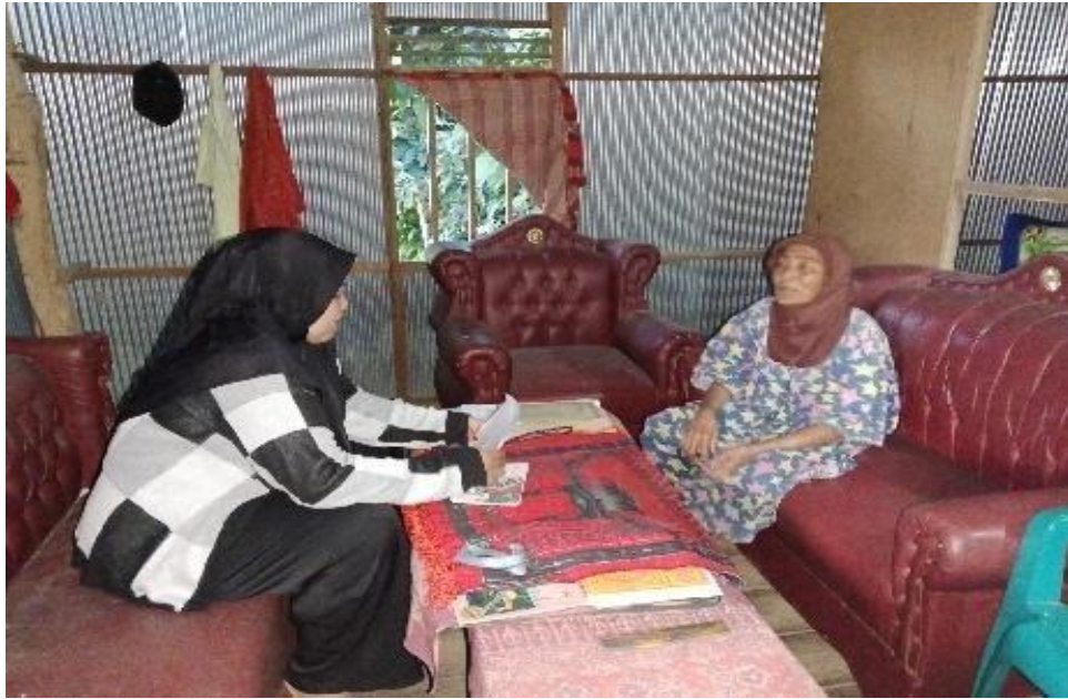
Gambar 3.3 Penyedia Jasa