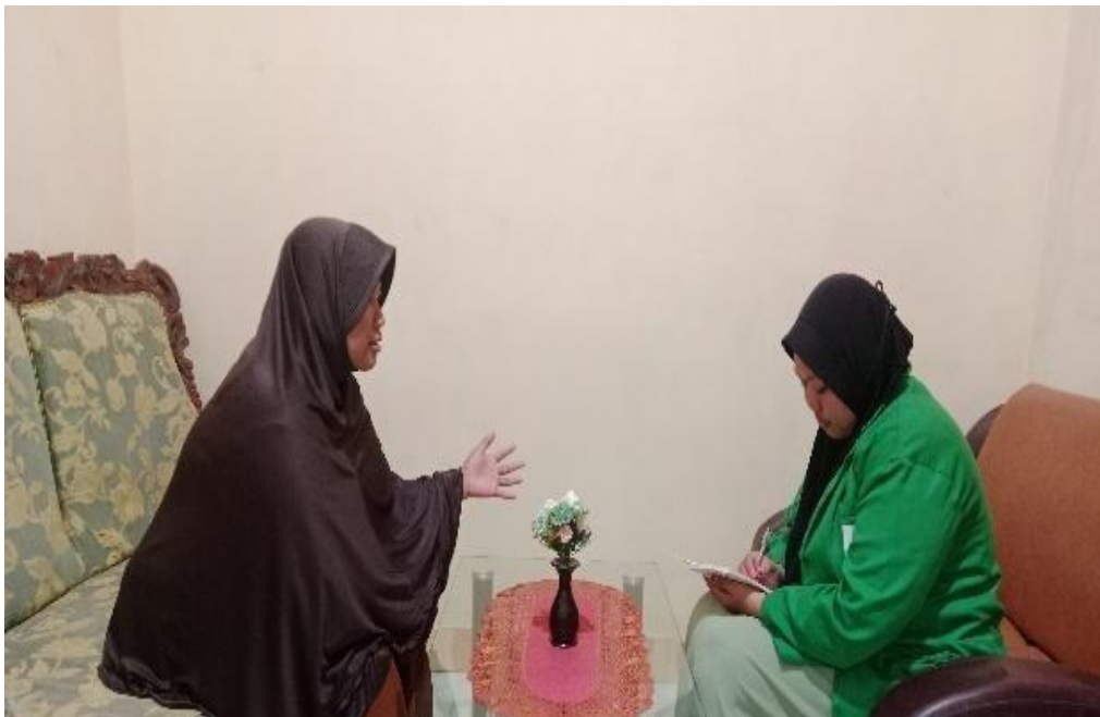
Gambar 2. 2 Pengguna Jasa