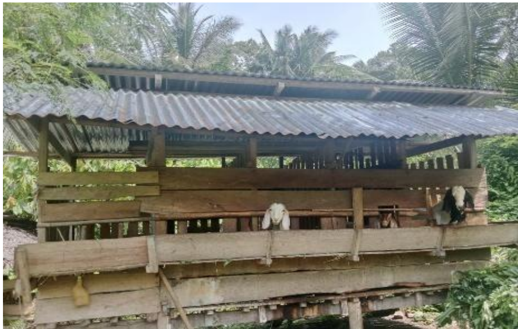
Gambar 10. 10 Kandang Kambing