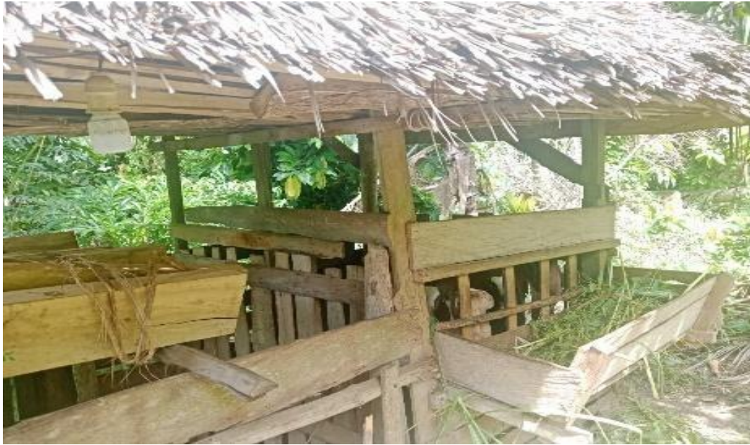
Gambar 9. 9 Kandang Kambing