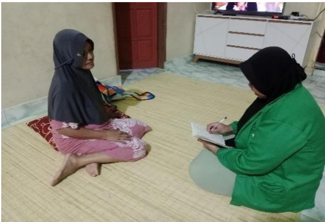
Gambar 8. 8 Pengguna Jasa