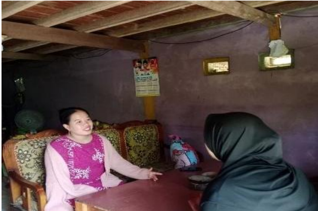
Gambar 7. 7 Pengguna Jasa