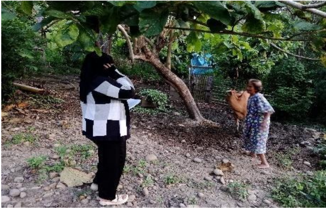
Gambar 5. 5 Penyedia Jasa