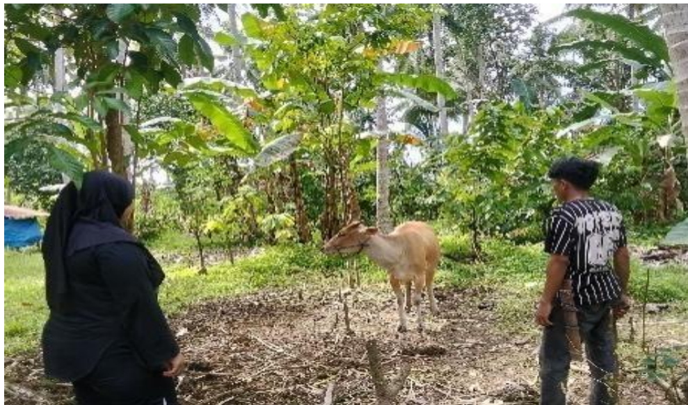
Gambar 4.4 Penyedia Jasa