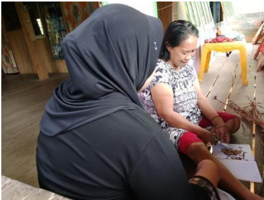
Gambar 6. 6 Penyedia Jasa