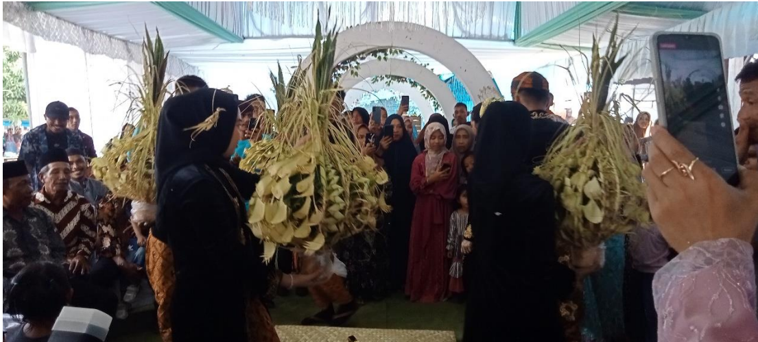
Gambar 9. Sindhur binayang (Kedua pengantin dibalut dengan kain jare' )