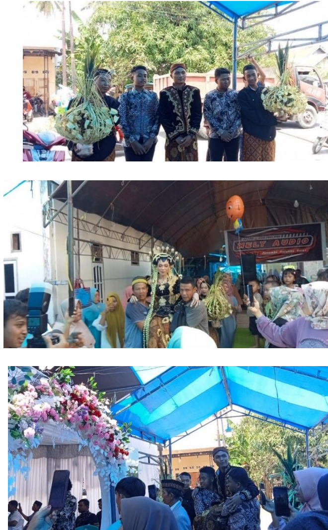
Gambar 1. Prosesi Mertui

Berdasarkan pengamatan peneliti, mertui adalah penjemputan pengantin pria yang dimana prosesi ini berlangsung kurang lebih empat menit, dimulai saat pengantin pria keluar dari tempat pelaksanaan ijab qobul menuju pintu masuk (penjemput tamu) dengan ditemani pihak keluarga dari mempelai wanita yang mengutus empat orang laki-laki diantaranya, dua orang laki-laki yang masih lajang sebagai pemegang kembar