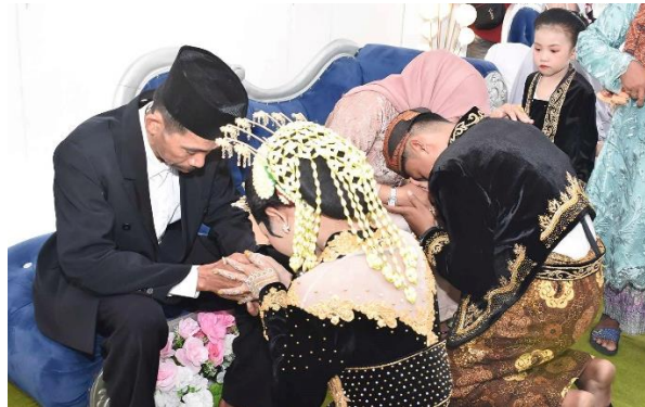
Gambar 5. Prosesi Sungkeman