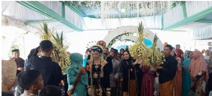
Menukarkan Kembar mayang

Setelah balang gantal selesai dilanjutkan dengan prosesi wijik kembang setaman pada prosesi ini ada beberapa ritual yang dilakukan diantaranya kucur-kucur , sungkeman , keliling bunga dan menukarkan kembar mayang . Ritual kucur-kucur kedua mempelai saling berhadapan, dan di samping kanan kiri mereka ada berjanggah yang