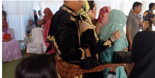
Gambar 4. Prosesi Sindhur Binayang