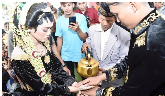
Gambar 3. Prosesi Wijik Kembang Setaman