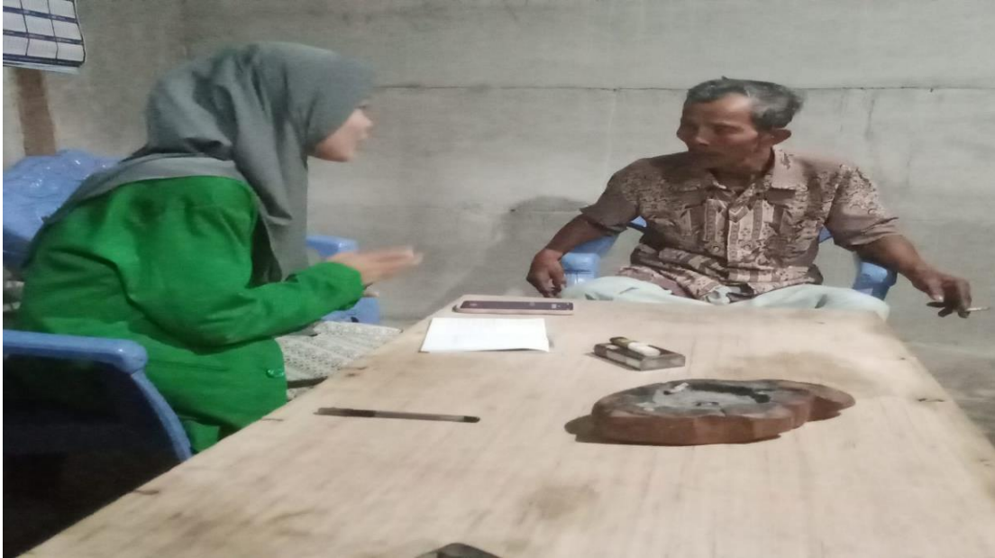
Gambar 4. Wawancara Dengan Tokoh Agama