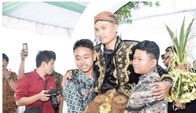
Gambar 2. Prosesi Balang Gantal