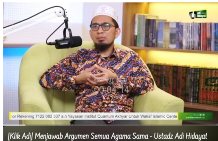
Gambar 4.2 Cuplikan Layar Video “(Klik Adi) Menjawab Argumen semua Agama sama”

Video berjudul “(Klik Adi) Menjawab Argumen semua Agama sama” pertama kali dipublikasikan pada 16 Oktober 2021 di kanal YouTube Adi Hidayat Official. Sejak perilisannya, video ini telah menarik perhatian banyak penonton, dengan jumlah tayangan mencapai 787 ribu kali hingga 21 Januari 2025. Selain itu, video ini juga mendapat tanggapan dari para pemirsa dengan 1,7 ribu komentar yang turut memperkaya diskusi mengenai topik yang dibahas