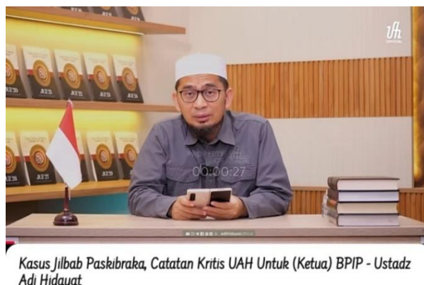
Gambar 4.5 Cuplikan Layar Video “Kasus Jilbab Paskibraka, Catatan Kritis UAH Untuk (Ketua) BPIP”