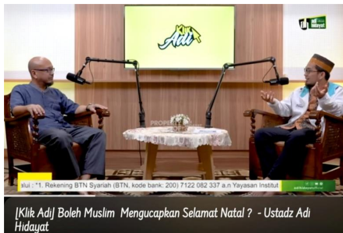
Gambar 4.4 Cuplikan Layar Video “(Klik Adij) Boleh Muslim mengucapkan Selamat Natal?”