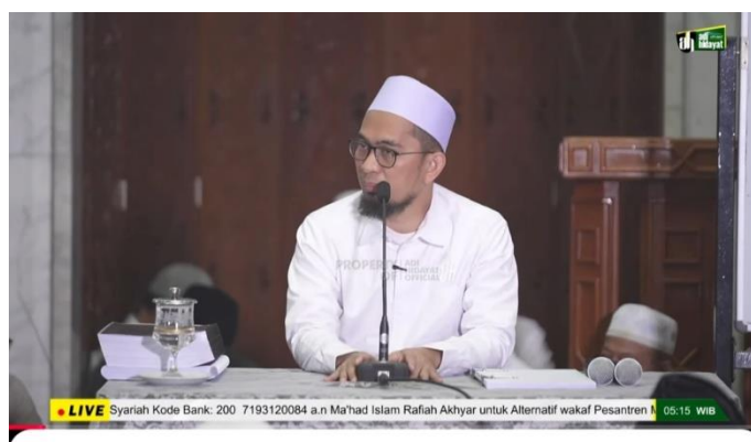
[LIVE] Musik Dalam Timbangan Al-Qur'an dan Sunnah - Ustadz Adi Hidayat

Video berjudul “Musik Dalam Timbangan Al-Qur'an dan Sunnah” pertama kali dipublikasikan pada 05 Mei 2024 di kanal YouTube Adi Hidayat Official. Sejak perilisannya, video ini telah menarik perhatian banyak penonton, dengan jumlah tayangan mencapai 505 ribu kali hingga 08 Juli 2025. Selain itu, video ini juga mendapat tanggapan dari para pemirsa dengan 7,1 ribu komentar yang turut memperkaya diskusi mengenai topik yang dibahas.