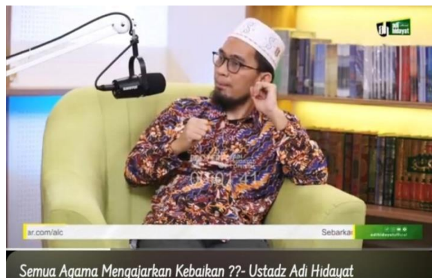
Gambar 4.3 Cuplikan Layar Video “Semua Agama Mengajarkan Kebaikan”

Tabel berikut menyajikan unsur penanda ( signifier ) dan petanda ( signified ) dari video tersebut yang bertujuan untuk memudahkan interpretasi pesan moderasi beragama yang disampaikan oleh Ustadz Adi Hidayat.