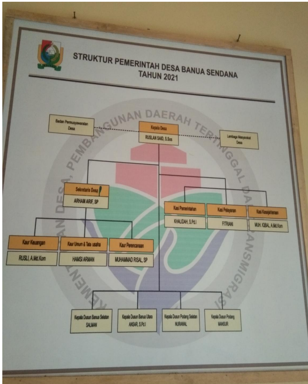
Gambar 4.1 Struktur Pemerinta Desa Banua Sendana Tahun 2021