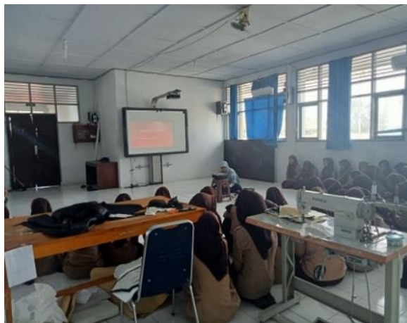
Ket: proses kajian sedang berlangsung

informasi tentang guru yang membawakan materi kajian, yakni pada saat observasi peneliti melihat proses kajian yang dilaksanakan setiap jumat oleh guru tersebut peserta didik di perbolehkan bertanya mengenai materi kemudian peserta didik diwajibkan mencatat ringkasan materi yang di bawakan oleh guru tersebut.