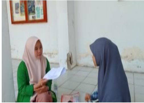
Ket: wawancara dengan peserta didik, triwulan