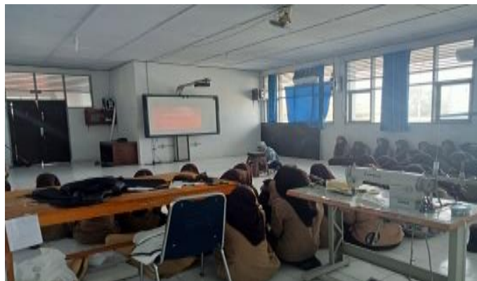
Ket: kegiatan kajian rutin yang dilaksanakan setiap jumat