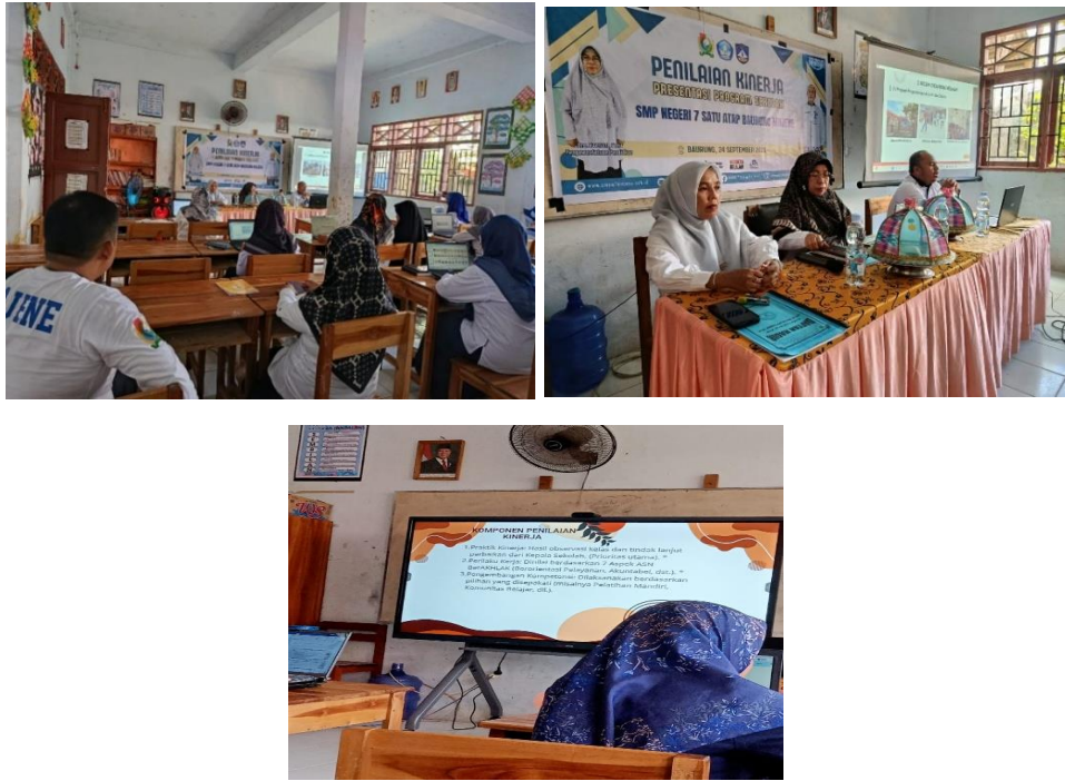
Gambar 9 Kegiatan Penilaian Kinerja