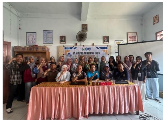
Gambar 7 In House Training (IHT)