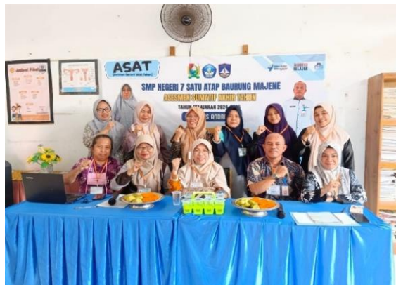
Gambar 6 Kegiatan Asesmen Sumatif Akhir Tahun