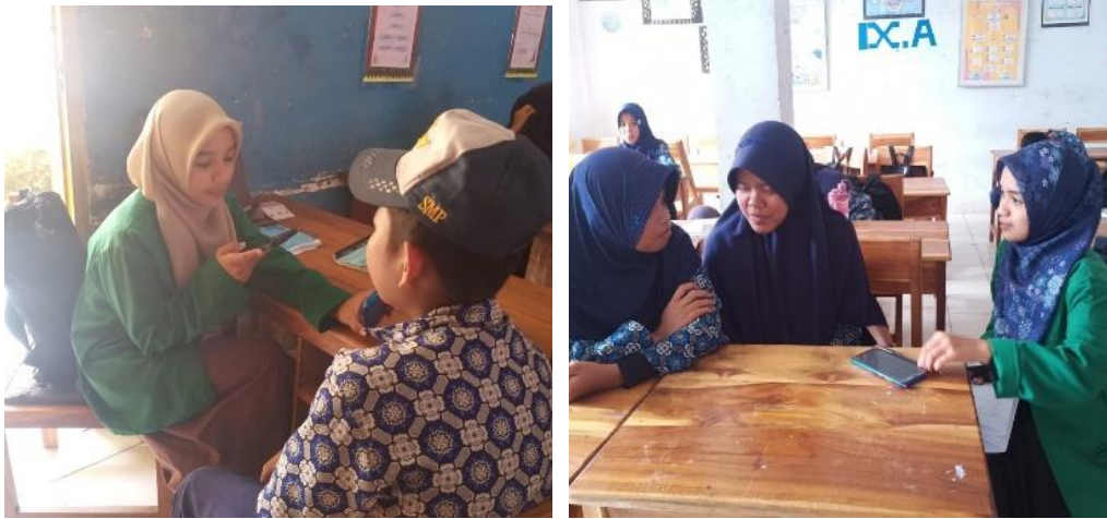
Gambar 4 Wawancara dengan Peserta Didik