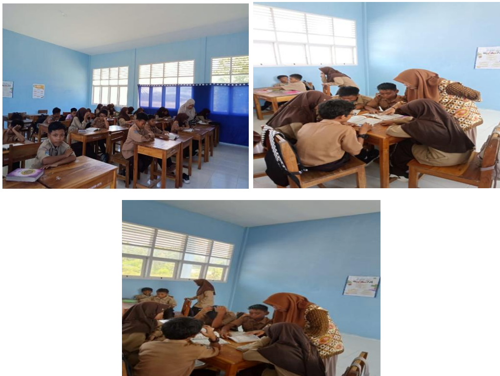
Gambar 10 Kegiatan Pengelolaan Kelas