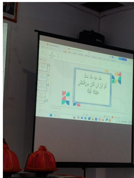
Gambar 8 Kegiatan Musyawarah Guru Mata Pelajaran Pendidikan Agama Islam (MGMP-PAI)