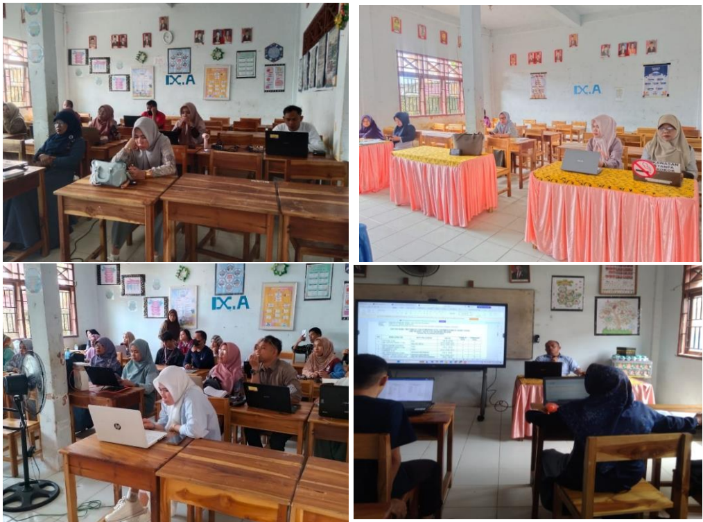
Gambar 5 Kegiatan Kelompok Belajar (KOMBEL)