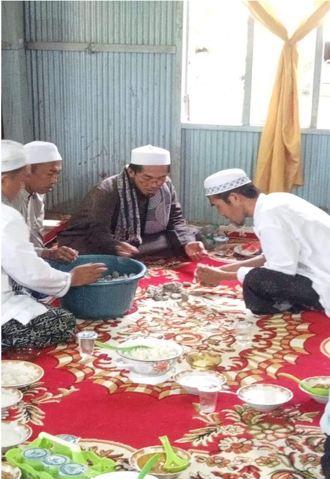
Pelaksanaan tradisi dzikir mambatu-batu di Desa Pampusuang