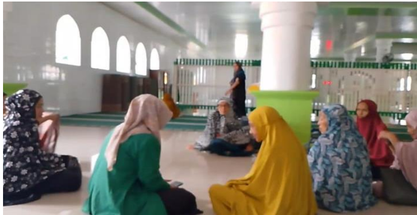
Ket. Wawancara dengan masyarakat Pambusuang