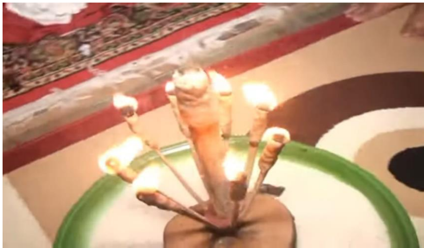
Ket. Gambar api Solung yang akan dipadamkan Oleh Mempelai Pria