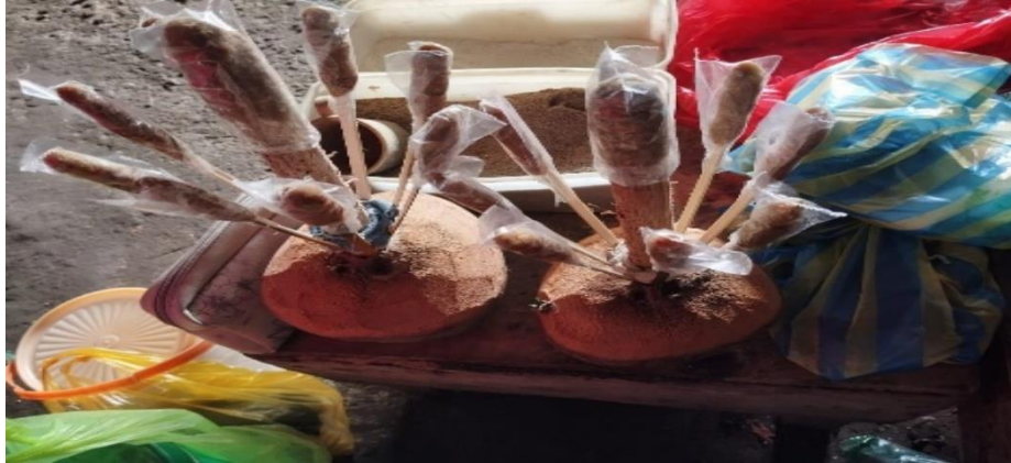
Ket. Gambar Solung