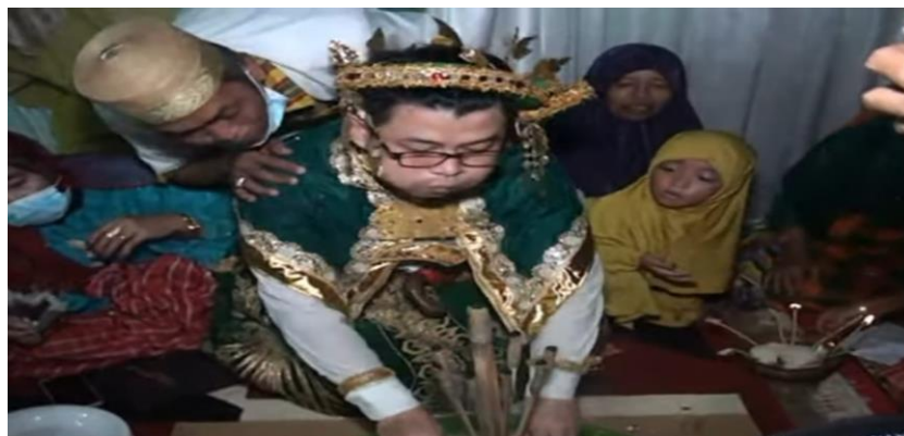
Ket. Gambar pengantin Pria memadamkan solung dan tetuah adat