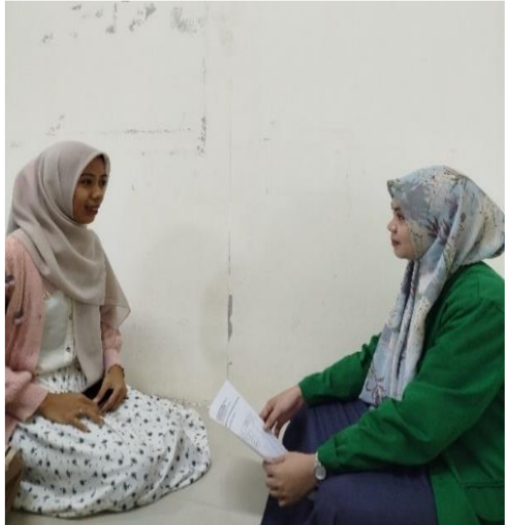
Wawancara dengan Anti