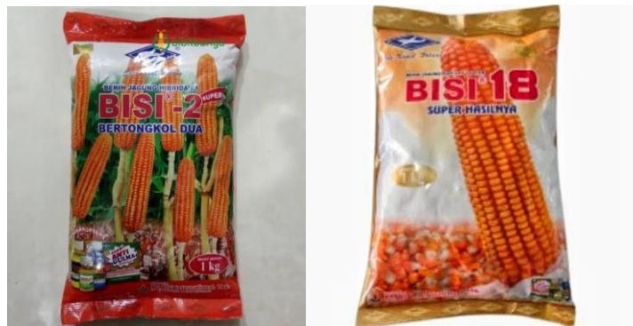
Gambar 4 .2 Benih jagung Bisi 2 dan Bisi 18

ini diperoleh dari bantuan pemerintah, maka benih itu gratis dan tidak ada pembayaran benih yang harus dilakukan.