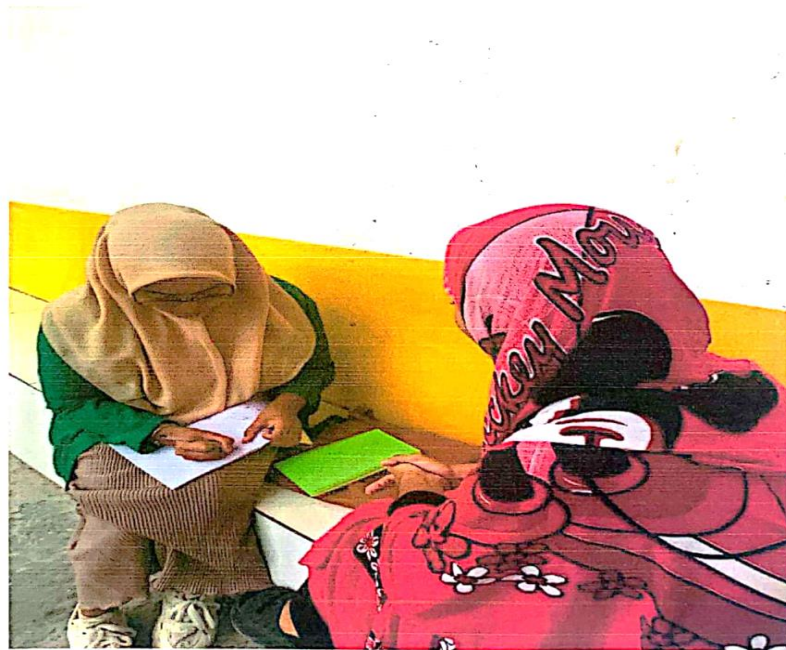
Wawancara dengan Ibu FK yang melakukan nikah siri