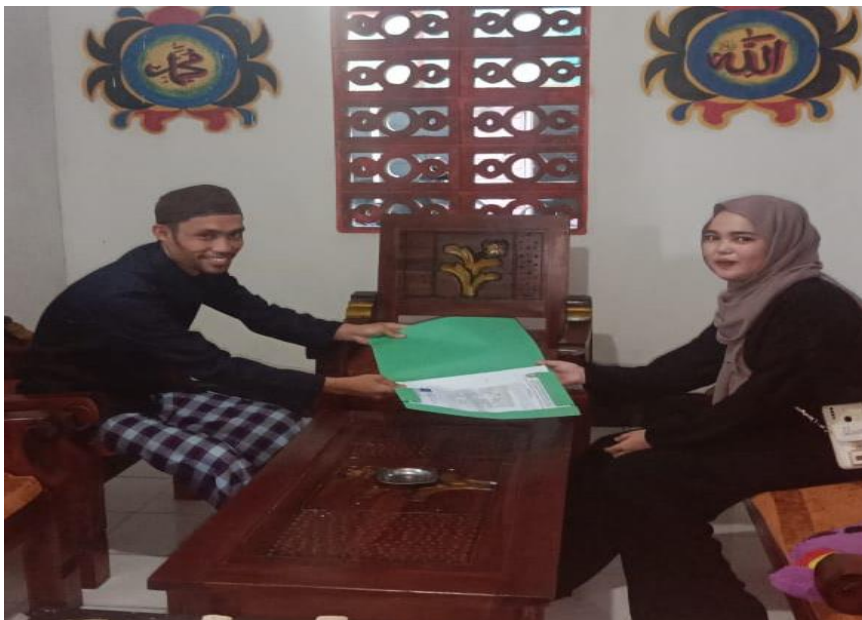
Gambar 2. Penyerahan surat izin penelitian serta wawancara