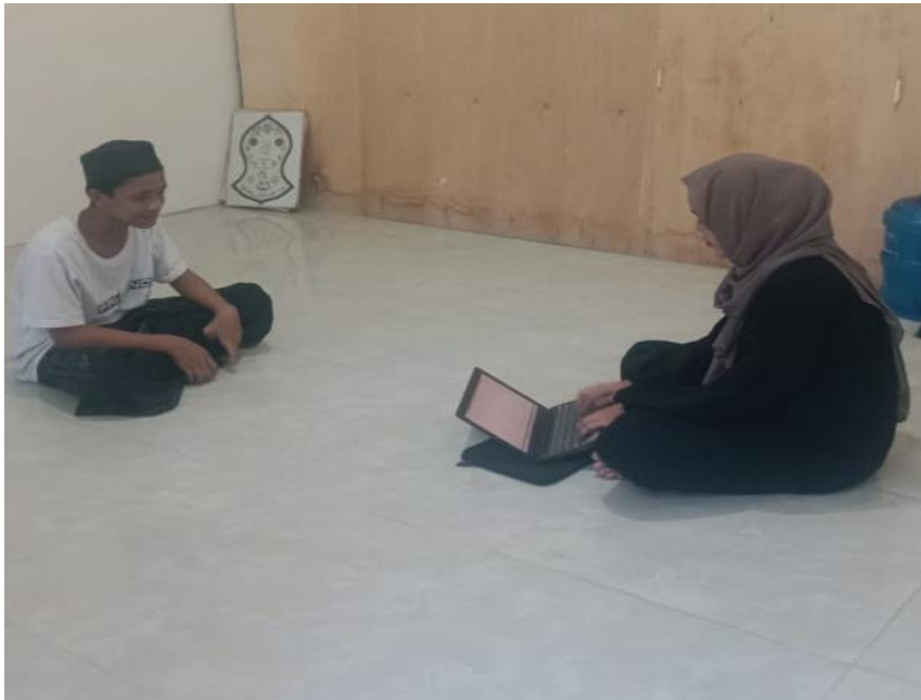
Gambar 5. Wawancara santri