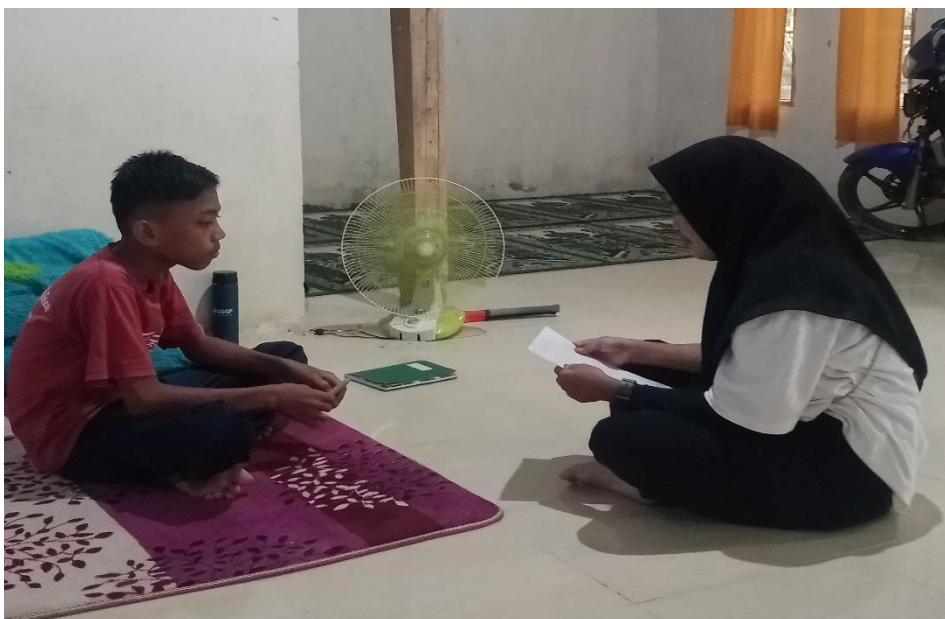
Gambar 4. Wawancara Santri