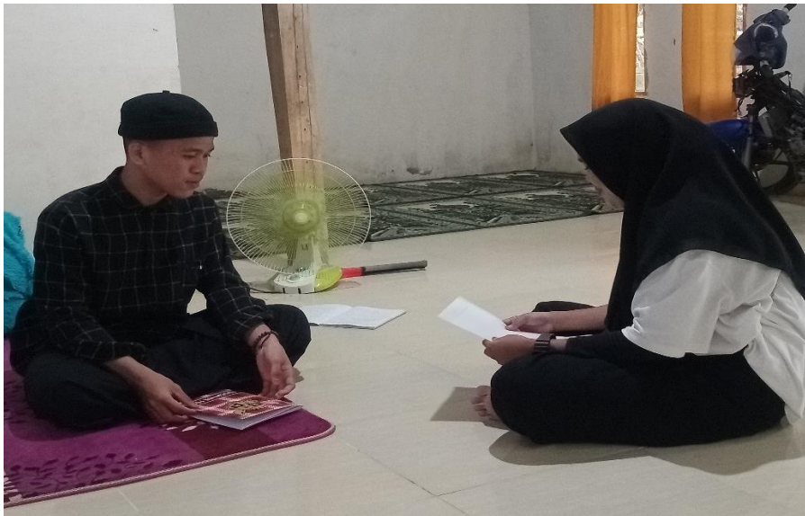
Gambar 3. Wawancara dengan Santri senior