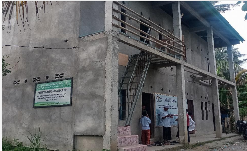
Gambar 1. Tampak Depan Ponpes Miftahul Jannah