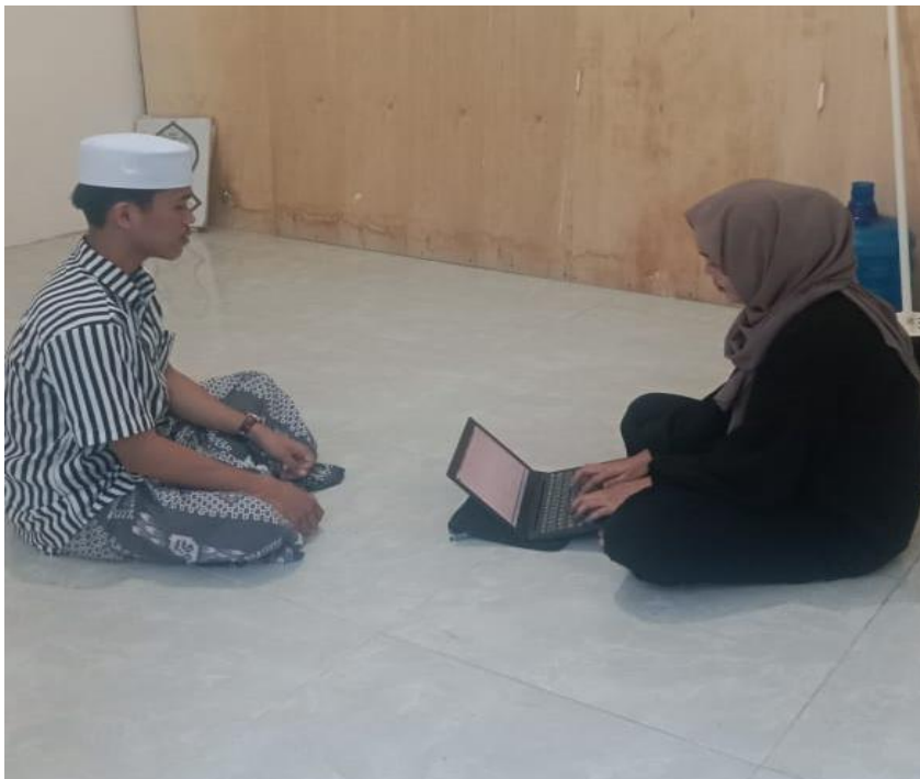
Gambar 6. Wawancara Santri