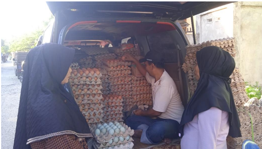
Foto keadaan pasar saat ramai