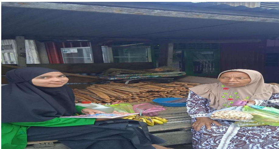
Foto kios dan keadaan pedagang sembako