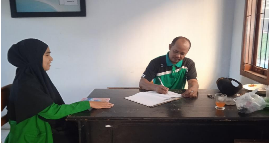
Foto wawancara para pedagang sembako

Foto wawancara kepala UPTD/ pengelola pasar