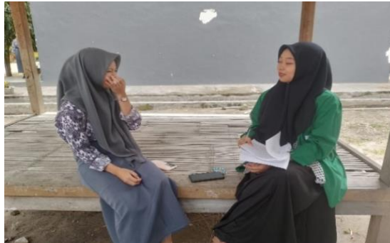
Lampiran 10. Wawancara Peserta Didik XI. 5