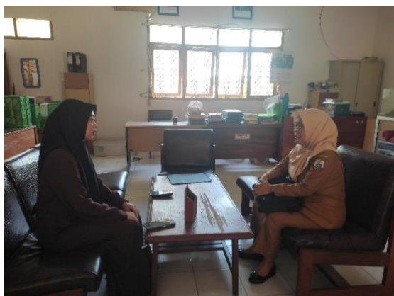
Lampiran 7. Wawancara dengan guru P