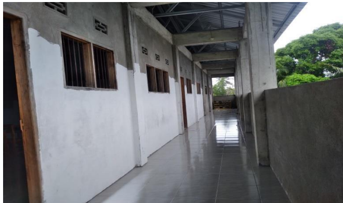
SD IT Tahfidzul Qur'an Majene