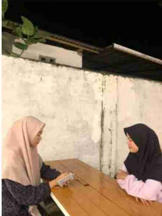
Wawancara dengan owner handbody racikan micisbeauty