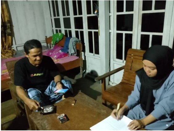
Wawancara bersama bapak kading.