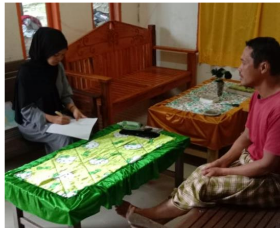
Wawancara bersama bapak ambas.