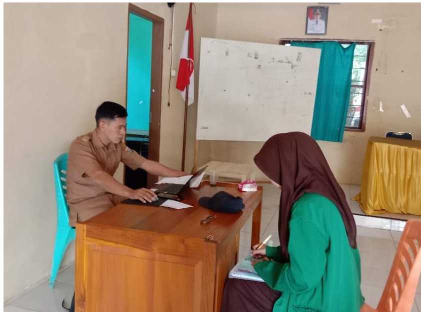
Pertemuan dengan Sekdes (meminta Izin meneliti).